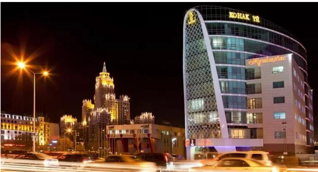
Рисунок 6. Бизнес отель «Жумбактас».