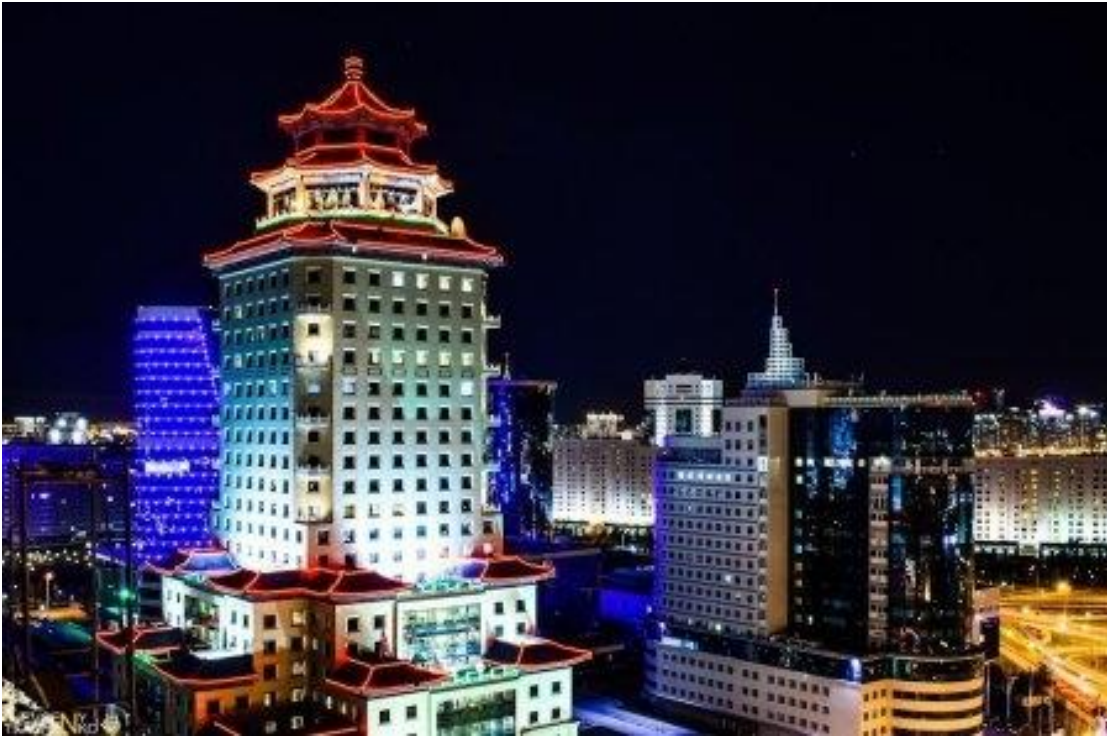
Рисунок 5. Пекин Палас Soluxe Hotel Astana 5*.