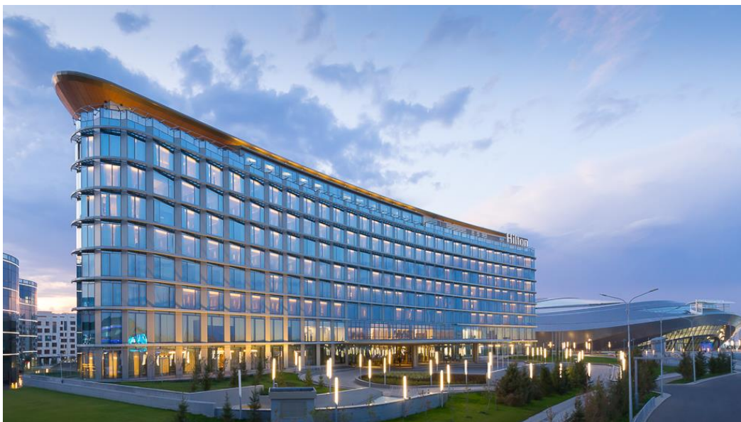
Рисунок 1. Отель Hilton Астана.

Комфортабельный бизнес отель «Жумбактас», удачно расположившийся в новом центре Астаны. «Жумбактас» выполнен в роскошном национальном духе. Отель предлагает гостям 60 номеров, из окон которых открывается прекрасный панорамный вид на современную столицу Казахстана (Рисунок 6).