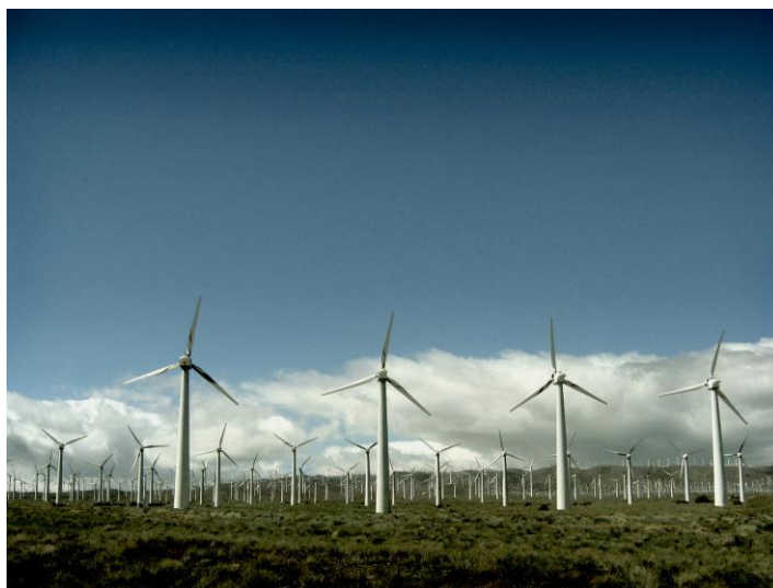
Рис.3. Проект ветропарка в Великобритании.