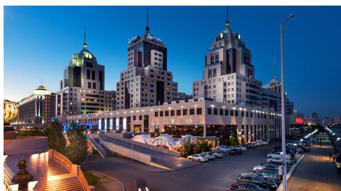
Рисунок 4. Рэдиссон Отель Астана.