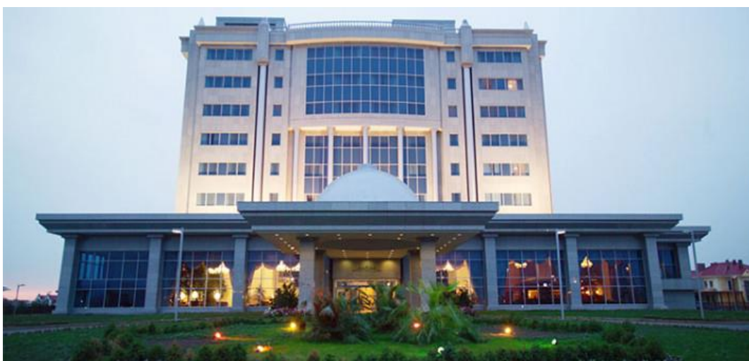
Рисунок 2. Отель Rixos President Astana 5*.