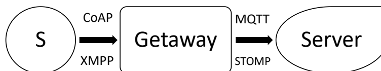
Рисунок 1. Структура связи гетерогенных сенсоров с сервером через шлюз (Getaway)

IoT-шлюз — это технология, обеспечивающая передачу данных через их преобразование в стандартный формат устройства, для которого данные предназначены. Шлюзом может быть устройство, работающее с различными протоколами устройств и форматами данных [7]. При этом шлюз становится идеальным инструментом для создания интерфейса управления всем Умным домом. Группировка необработанного потока информации или сбор разрозненных показателей в пакеты и отправка их на сервер в виде одного файла позволяют добиться высокой эффективности передачи данных.