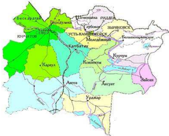
Сурет 1 – Шығыс Қазақстан облысының әкімшілік бөлінісі

Облыста 19 әкімшілік – аумақтық бірлік саналады, соның ішінде 15 аудан, 10 қала, 754 ауыл мен кент, 246 ауылдық және кенттік округтер Облыстың негізгі қалалары – 316,9 халығымен және 313,7 мың тұрғын тиісінше Өскемен және Семей. Сонымен қатар 4 моноқала бар: Курчатов (ғылыми – өнеркәсіп орталығы), Серебрянск (химиялық өнеркәсіп), Риддер және Зырян (метал кендерінің өндіру), және 4 шағын қала: Аягөз (көліктік торап), Шар (цементтік өнеркәсіп), Зайсан (ауыл шаруашылық, туризм), Шемонаиха (тау –кен өнеркәсібі және ауыл шаруашылығы). (1 сурет). [1].