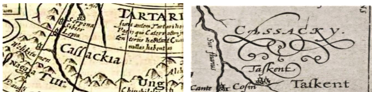
1-сурет. XVI-XIX ғасырлардағы еуропалық карталардағы Қазақ мемлекетінің атаулары