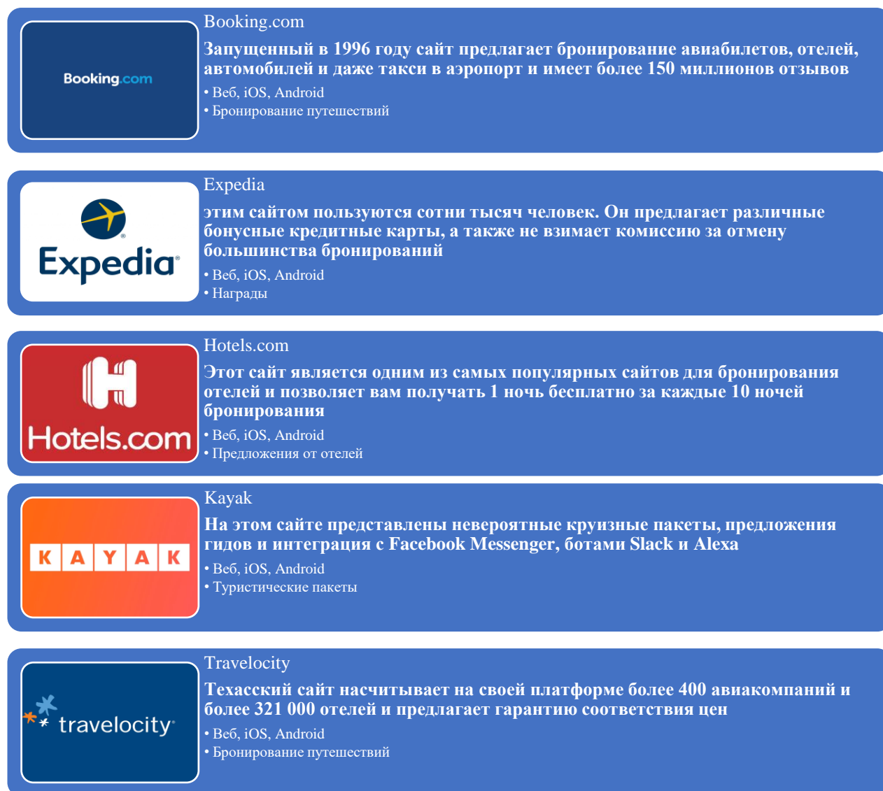
Рисунок 1 - Топ-5 сайтов для онлайн-бронирования в сфере туризма на 2024 год (Создано автором на основании источника [3])

бронирования по состоянию на 2024 год (Рисунок1).