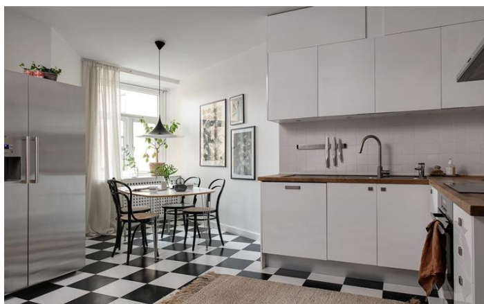
Рис. 5 Лаконичность скандинавского стиля

Простая эргономичная мебель. В употреблении только лаконичная и функциональная мебель. Важен точный расчет, высшая степень удобства использования, простота геометрии и максимальная эргономичность.