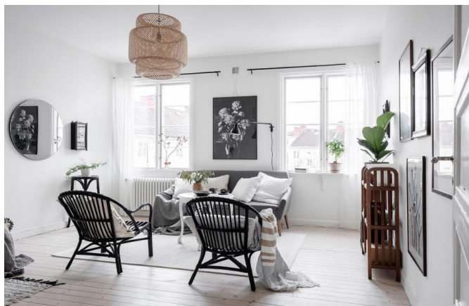
Рис. 8 Особенности скандинавского стиля

Аксессуары и декор. Их обычно немного, они невычурны и функциональны, не создают лишних помех. Часто используются зеркала – для отражения естественного света, постеры и абстрактные полотна – в качестве цветовых и стилистических акцентов, комнатные растения – для усиления эффекта сближения с природой, а также привнесения цвета и текстуры без загромождения пространства.