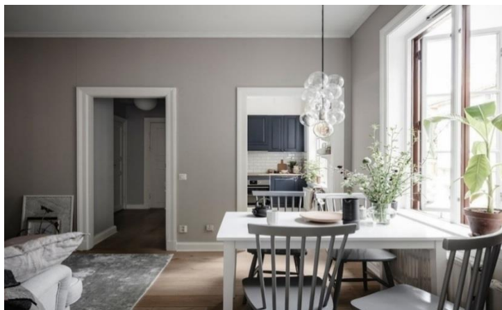
Рис. 4 Просторная кухня-гостиная в скандинавском стиле

Ощущение свободного пространства. В северных традициях не захламлять пространство квартиры излишними деталями – должно быть ощущение воздуха, свободного пространства. У мебели и предметов должно быть «пространство, чтобы дышать».