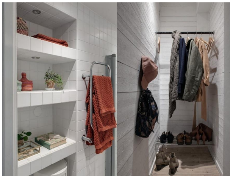
Рис. 7 Открытые полки. открытое место ванной в скандинавском стиле для хранения в прихожей

места. В комнате должно быть достаточно мест для хранения, но без загромождения, поэтому преимущественно находят применение открытые стеллажи и системы хранения.