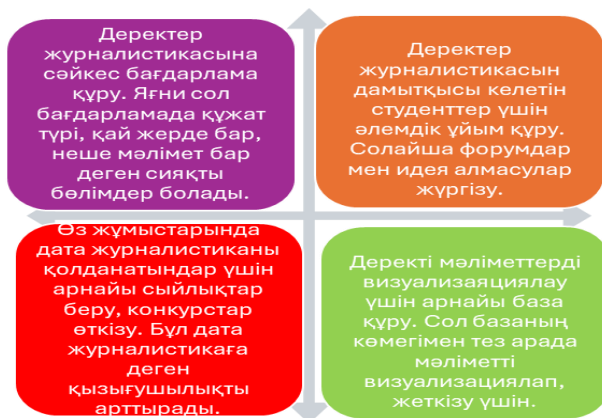
Кесте-3. Деректер журналистикасын дамытудағы ұсыныс

Деректер журналистикасын әр бағыт бойынша дамытуға болады. Бірақ басты фактор – ақпарат және оны құраушы адамдар. Ақпаратты әртүрлі бағдарламаға салып, жүйеленген ақпарат көзін алу үшін база құруға болады, оны жеткізу үшін визуализациялау үшін арнайы мультимедиялық құрылғыларды ойлап табуға болады. Болашақ журналистер үшін арнайы ұйым ашып, семинар ұйымдастыруға болса, дайын журналистер үшін ынталандыратын конкурстар жасап, сыйлықтар беруге болады.