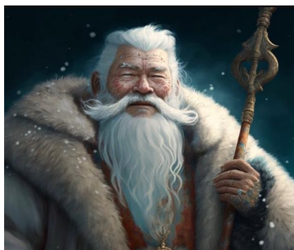
Figure 5 (Bulatkulova, 2023) [3]