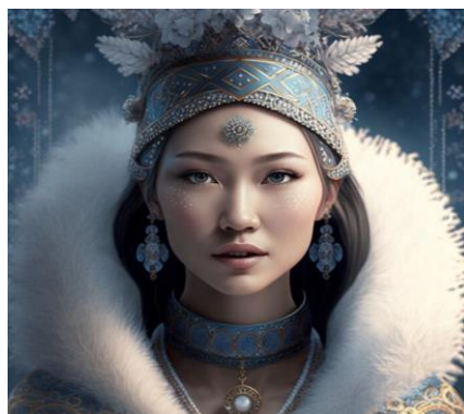
Figure 6 (Bulatkulova, 2023) [3]

Қорытындылай келе, жасанды интеллект пен журналистика арасындағы симбиотикалық қарым-қатынас мүмкіндіктер мен түйіткілдердің динамикалық көрінісін ұсынады. ЖИ журналистиканың белгілі аспектілерін арттыруда керемет әлеуетті көрсетіп қана қоймай, әртүрлі жанрлардағы эмпатиялық және көп қырлы шығармашылық мүмкіндіктерді толыққанды жеткізе алмайтыны айқын. Сондықтан жасанды интеллектіні журналистикада ақпараттарды жинақтау, талдау және фото видеоларды дыбыстарды өңдеу өнімдердің визуалды сапасын арттыруға көмекші құрал ретінде тиімді пайдалануға болады, бірақ ол адам бойында бар ерекше қасиет эмоциялық сезімдері жеткізе алмайтының түсінуіміз қажет.