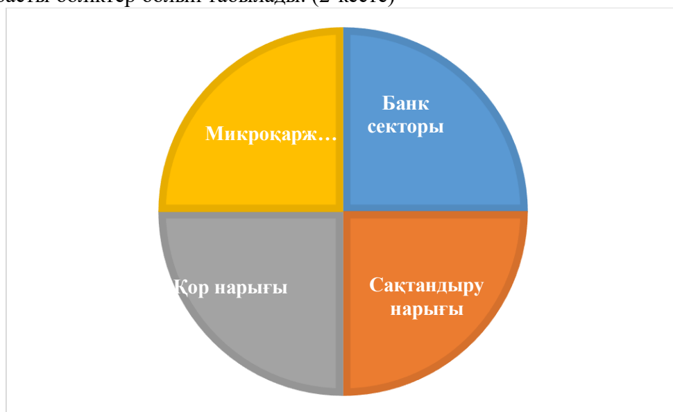
Кесте 2. Қаржы секторы Ескерту – автормен құрастырылған

Қаржы секторын талдау барысында банк секторын, сақтандыру секторын, қор нарығын, микроқаржыландыру нарығын қозғамай кетуге болмайды, себебі олар тікелей қаржы секторын құрайтын басты бөліктер болып табылады. (2-кесте)