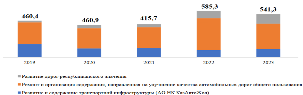
Рисунок 2 - Объем финансирования автодорог за 2019-2023 годы Примечание: основано на источнике [4]

В частности, в 2023 году на развитие автодорог, в том числе ремонт, содержание, улучшение качества, строительство и реконструкцию автомобильных дорог за счет внешних займов, трансфертов из Нацфонда и средств республиканского бюджета было выделено 541,3 млрд тенге [4].