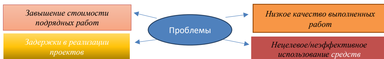
Рисунок 3 - Проблемы и вызовы, выявленные по итогам государственных аудитов Примечание: составлено автором на основе источников [4;5]

ВАП РК и другими органами государственного аудита проводятся аудиторские мероприятия в автодорожной отрасли, где выявляются различные финансовые и процедурные нарушения, а также недостатки. Несмотря на значительные объемы финансирования, государственный аудит выявляет ряд проблем, связанных с неэффективным использованием бюджетных средств.