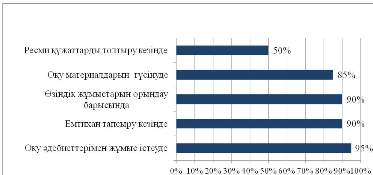
1 сурет. Қазақ диаспорасы өкілдері болып табылатын шетелдік студенттердің ЖОО коммуникативтік бейімделу қиыншылықтарының себептері

ауызбіршілік деңгейі, тұлғааралық перцепция, білім алушылардың өзара әрекетке дайындығы. Жүргізілген сауалнама қорытындысы көрсеткендей, қазақ диаспорасы өкілдері болып табылатын шетелдік студенттерге ЖОО білім алу қиын, себебі олардың (3%) климатқа үйрене алмайды, қаржылық қиындығы барлар - (8%), орыс тілін айтпағанда (ауызша сөйлеу деңгейінің төмендігі мен жазу тәжірибесінің жоқтығы) қазақ тілінде тәжірибесі төмендігі - (95%), қазақ тілінде оқулықтар оқу мен өзіндік жұмыстарды орындауда қиналатындар - (90%), дәріс жазуға қиналатындар - (95%), практикалық сабақта (95%) және емтиханда жауап беруге қиналатындар - (90%). Университеттен тыс жерлерде - 76% студент орысша сөйлеу дағдысының жоқтығынан өздерін қолайсыз жағдайда сезінеді.