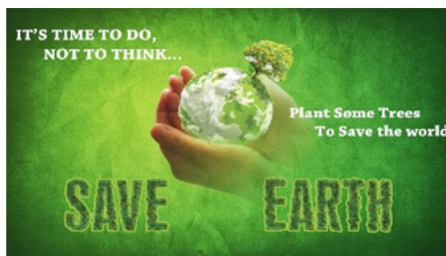
Рисунок 3. Рекламное обращение

Следующий пример, «It's time to do, not to think... Plant Some Trees To Save the world, SAVE EARTH» и «Давайте всем миром, В любую погоду, Будем беречь родную природу!» (рис.3). Смысловые единицы в обеих рекламах это: Беречь, Мир, Земля, Природа, Погода. Обе рекламы зеленого цвета обозначают природу: зеленый земной шар, на котором растёт зеленое дерево, а человек руками держит земной шар. Идея текста - призыв ко всем людям планеты беречь землю.