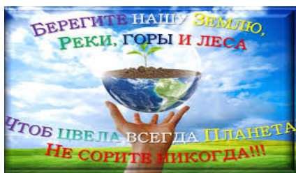
Рисунок 1. Рекламное обращение

всегда Планета, Не сорите никогда!!!» (рис.1) и «Heal the Earth, Heal our Future» (рис.2). Смысловая единица в обеих этих рекламах это: Земля, Будущее, Реки, горы, леса, Планета.