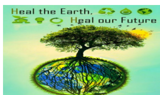
Рисунок 2. Рекламное обращение

Прокомментируем текст этих реклам и дадим пояснения основным его элементам. Данный текст пишется в повелительном тоне, как обращение в уважительной форме, как просьба. Читатель воспринимает этот текст с доминирующим призывом в повелительной форме безболезненно из-за того, что такого рода реклама обращена каждому члену общества. Следовательно, в рекламах экологического содержания весь текст состоит из эко-фразы - как в английском, так и в русском языках, то есть рекламы, которая состоит из заголовков, рисунков и кратких высказываний.