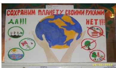
Рисунок 5. Рекламное обращение

В рекламе на русском языке «Сохраним планету своими руками ДА! НЕТ!» - голубой земной шар на белом фоне. Реклама разделена на две части: на правой стороне слово «ДА!» означает поддержку природы - рисунки «зеленая трава», «насекомые» и «море с рыбами». На левой стороне слово «НЕТ!» обозначает «не загрязнять природу», «не рубить деревья».