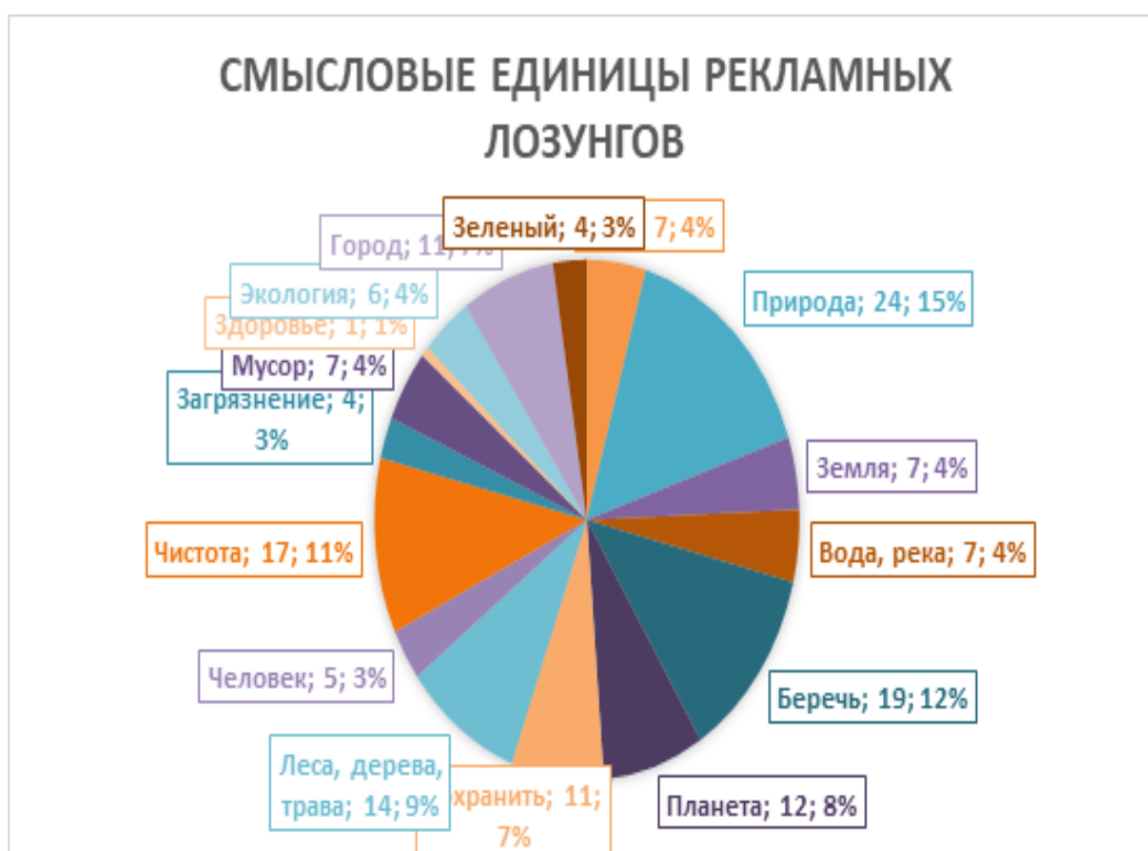
Рисунок 7. Смысловые единицы рекламных лозунгов