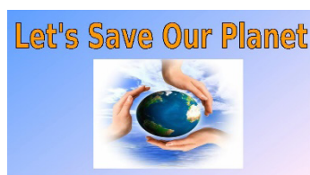
Рисунок 4. Рекламное обращение

В рекламе на русском языке «Сохраним планету своими руками ДА! НЕТ!» - голубой земной шар на белом фоне. Реклама разделена на две части: на правой стороне слово «ДА!» означает поддержку природы - рисунки «зеленая трава», «насекомые» и «море с рыбами». На левой стороне слово «НЕТ!» обозначает «не загрязнять природу», «не рубить деревья».