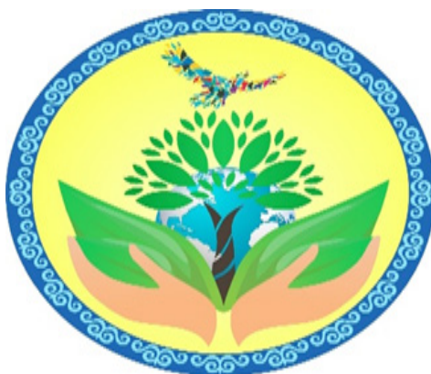
Рисунок 8. Эмблема экологизации образования (ЕНУ им. Л.Н.Гумилева)

При изучении экологических рекламных текстов волонтерами были усвоены основные направления семантики воздействия. Следует отметить малое количество реклам экологического содержания в нашей стране. Это натолкнуло нас на мысль проводить с волонтерами-студентами различные акции, в которых выделялся бы один конкретный аспект экологических проблем. В первую очередь, им было предложено придумать эмблему для общего экологического движения. В апреле 2018 года в ЕНУ им. Л.Н.Гумилева был проведен Международный научно-практический семинар, на котором впервые была представлена данная эмблема (рис.8).