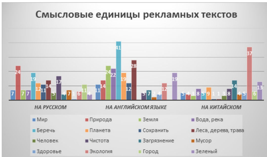
Рисунок 6. Смысловые единицы рекламных текстов