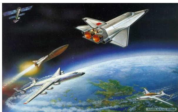
Рисунок 3 – Компьютерное моделирование полета летательных аппаратов

Еще одно преимущество виртуальных лабораторных работ по сравнению с традиционными заключается в безопасности. В частности, использование виртуальных лабораторных работ в случаях, где идет работа с высоким напряжением или опасными брызгантными веществами, а также при старте ракет-носителей (Рисунок 3).