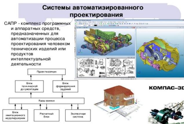
Рисунок 5 – САПР системы проектирования

При этом используются системы автоматизированного проектирования (САПР) аэрокосмической техники, планирования цехов и участков машиностроительного производства (Рисунок 5).