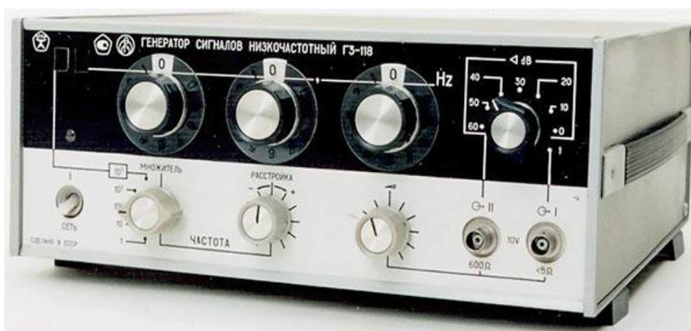
Рисунок 1 –Генератор сигналов низкочастотный ГЗ-118

Генераторы сигналов низкой частоты ГЗ-118 играют ключевую роль в различных областях науки и техники, включая радиотехнику, электронику и системы автоматизации. Одним из основных параметров, определяющих качество и точность работы таких генераторов, является выходное напряжение. Точное измерение выходного напряжения критически важно для обеспечения надежности и стабильности работы электронных устройств, которые используют эти сигналы (рисунок 1).