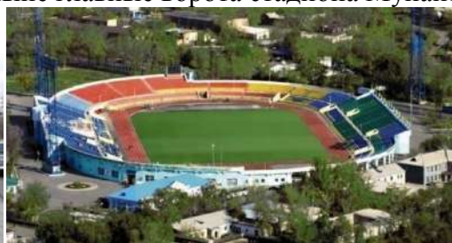
Центральный стадион имени Х. Мунайтпасова

Хотя, если быть до конца точными, настоящая крепость была построена год спустя после штурма и Центральная башня ее стояла на месте ворот современного Центрального стадиона имени Х. Мунайтпасова. В любом случае улица и набережная, где установлен памятник, хану должны были быть знакомы. В Акмолинске нынешняя улица Кенесары застраивалась одной из первых. В те времена делилась она на две части. Первая, называвшаяся Театральной, брала начало в Слободке и кончалась около пожарной каланчи, на пересечении с улицей Думской. Затем шла центральная площадь с Гостиным двором (Старая площадь). Здесь, от углового дома И. Силина (теперь белорусское посольство), под названием Большая Базарная начиналась нечетная сторона второй части улицы.