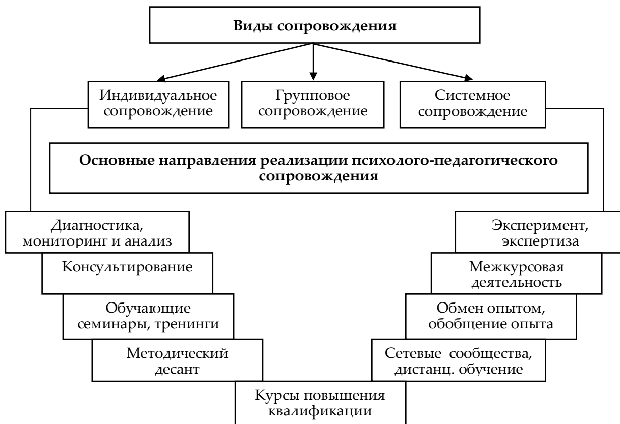
Виды и направления реализации модели психолого-педагогического сопровождения профессионального развития педагогов МКШ

Направления реализации модели психолого-педагогического сопровождения представлены на следующем рисунке.