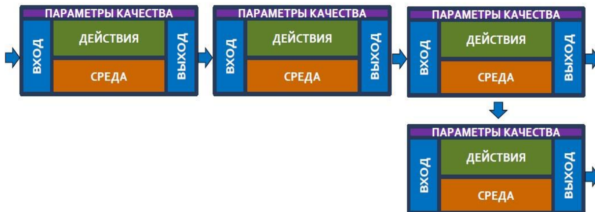
Рисунок 3 – Формализованный процесс

С помощью состояний мы в дальнейшем можем формализовать наш процесс для автоматизации.