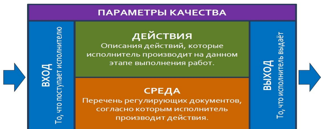
Рисунок 2 – Этап (состояния) процесса

Зная, что наш процесс имеет определенный порядок, участников этого процесса (потребителя) и в каком-то роде определенность мы можем поделить наш процесс на состояния.