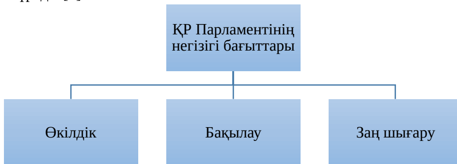
Сурет 1 - Қазақстан Республикасы Парламенті қызметінің негізгі бағыттары. Ескерту – автормен құрастырылған

1995 жылғы 30 тамызда республикалық референдумда қабылданған Қазақстан Республикасының Конституциясына сәйкес Қазақстан Республикасының қос палаталы Парламенті заң шығару билігін жүзеге асыратын Республиканың ең жоғары өкілді органы болып табылады. Парламент тұрақты негізде жұмыс істейтін екі Палатадан: Сенаттан және Мәжілістен тұрады.[1]