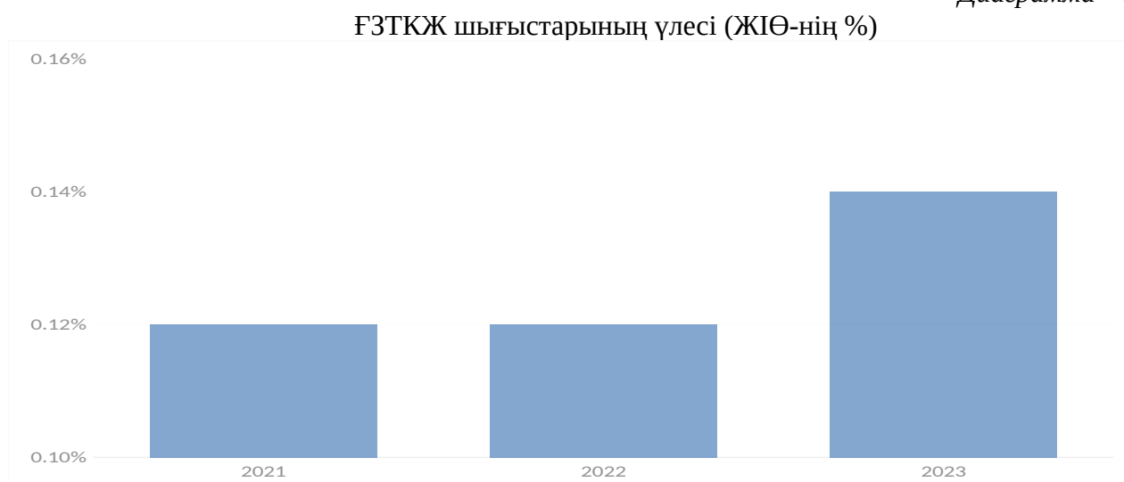
Диаграмма – 2