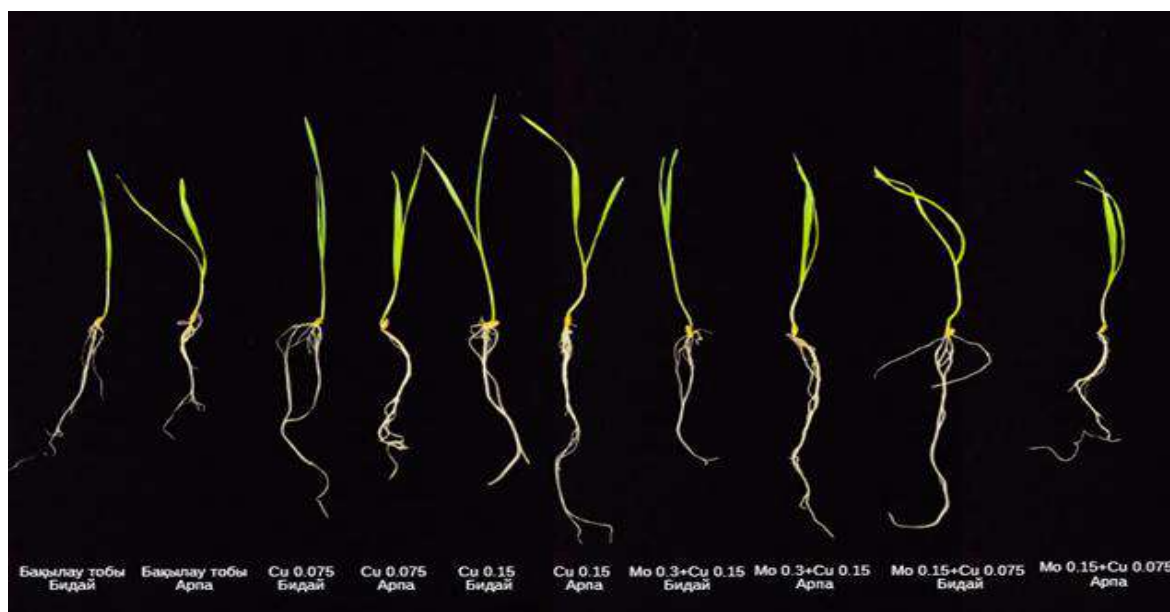
Сурет 1 10 күн бойы өсірілген өсімдіктердің морфологиялық бейнесі

Бақылау тобындағы өсімдіктер қалыпты дамып, металдар қосылмаған жағдайда өсуге кедергі болмады. \text{Cu } 0,075\text{ мМ} концентрациясы өсімдік дамуын тежемесе, \text{Cu } 0,15\text{ мМ} тамыр жүйесін қысқартып, сабақтарын әлсіретті. Мыстың молибденмен біріктірілген әсері әртүрлі нәтижелер берді (сурет 1).