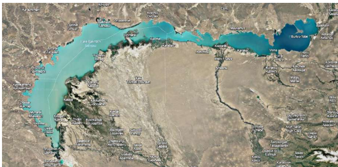
Рисунок 1 Озеро Балкаш фото со спутника за 2020 год [2]

Озеро Балхаш получает основное питание от рек, которые начинаются в горах Заилейского и Джунгарского Алатау. Общий объем поверхностных вод, образующихся в бассейне, составляет 28,85 км 3 в год. Из этого объема 22,87 км 3 приходится на бассейн реки Иле, 5,36 км 3 — на бассейн восточных притоков (Каратал, Аксу, Лепсы), 0,57 км 3 — на бассейн реки Аягоз и 0,08 км 3 — на бассейны рек Северного Прибалхашья. При этом 17,4 км 3 годового стока рек бассейна Балхаша формируется на территории Китая, в верховьях реки Иле.