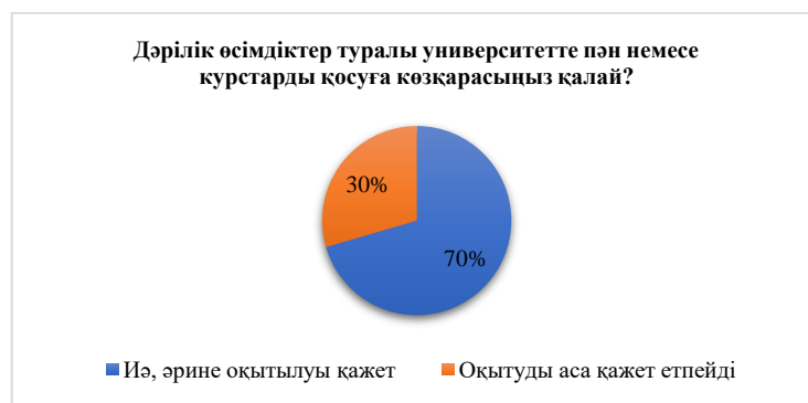
Сурет 5 Дәрілік өсімдіктер туралы арнайы пәндер немесе курстар енгізуге қатысты студенттердің көзқарастарын бағалау

Зерттеу нәтижелері дәрілік өсімдіктер туралы білімнің өзектілігін көрсетсе де, студенттердің 70%-ы арнайы курстарды қажет деп санаса, 30%-ы оны аса қажет емес деп есептейді, бұл осы тақырыпқа деген қызығушылықтың әртүрлі деңгейде екенін көрсетеді (5 сурет).