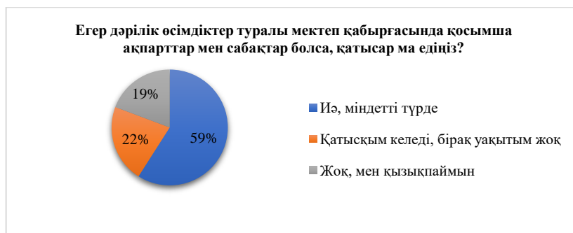
Сурет 4 Дәрілік өсімдіктер туралы қосымша ақпарат пен сабақтардың мектеп бағдарламасына енгізілуіне деген студенттердің қызығушылық деңгейін анықтау

Зерттеу нәтижелері дәрілік өсімдіктер туралы білімнің өзектілігін көрсетсе де, студенттердің 70%-ы арнайы курстарды қажет деп санаса, 30%-ы оны аса қажет емес деп есептейді, бұл осы тақырыпқа деген қызығушылықтың әртүрлі деңгейде екенін көрсетеді (5 сурет).