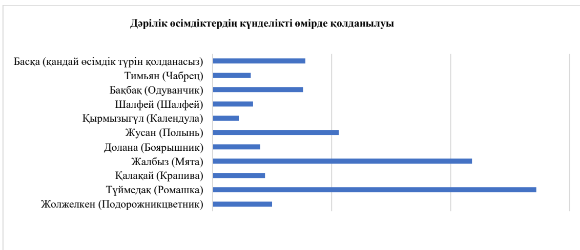
Сурет 3 Дәрілік өсімдіктер күнделікті өмірде қолданылуы

Зерттеу барысында студенттердің дәрілік өсімдіктерді тану және қолдану тәжірибесін анықтау мақсатында сауалнама жүргізілді (3 сурет). Нәтижелер бойынша ең танымал өсімдіктер: түймедақ (136 студент), жалбыз (109 студент) және жусан (53 студент). Сонымен қатар, бақбақ, долана, шалфей, тимьян, қырмызы гүл, қалақай және жолжелкен сияқты өсімдіктер де аталып, 39 студент басқа дәрілік өсімдіктерді қолданатынын көрсетті. Зерттеу студенттердің дәрілік өсімдіктер туралы белгілі бір білімі бар екенін және олардың фитотерапияға деген қызығушылығын айқындады. Бұл нәтижелер дәрілік өсімдіктер туралы білімді кеңейту және оқу бағдарламасына қосымша курстарды енгізу қажеттілігін көрсетеді.