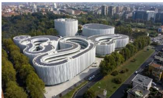
Рис.3 – Школа бизнеса и менеджмента SDA Bocconi School of Management в Милане

сейсмическую устойчивость. Например, проект SDA Bocconi School of Management в Милане использовал U-Boot Beton для создания изогнутых перекрытий, что позволило снизить нагрузку на каркас и улучшить сейсмическую производительность (рис. 3).