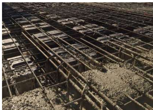
Рис. 2 – Технология U-Boot Beton

Однако важно учитывать, что пустотные плиты имеют сниженную способность к пробивному сдвигу, что требует усиления узлов соединения с колоннами. Например, исследования показывают, что способность к пробивному сдвигу может снизиться на 40% по сравнению с цельными плитами, и стандартные нормы, такие как ACI 318-14, EN 1992-1-1 и IS 456, требуют модификаций для точных расчетов. [5]