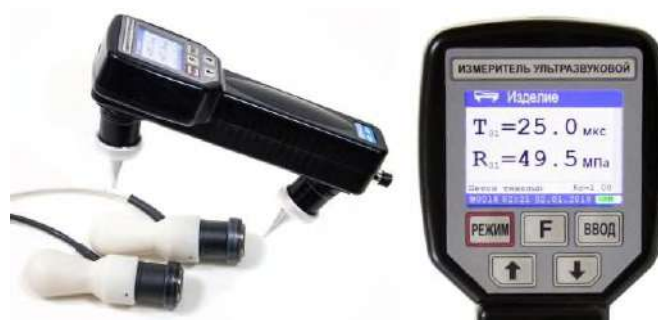
Рис. 1 – Прибор ультразвуковой контроль (УКС)

В Казахстане диагностика ЖБК сочетает традиционные и инновационные подходы. Наиболее распространены визуальный осмотр и неразрушающий контроль (НК), такие как ультразвуковой контроль (УКС) (рис. 1) и ударный импульс (ИПС) (рис. 2). Эти способы помогают обнаружить трещины или слабые места с высокой точностью, но они не всегда эффективны для глубоких слоев бетона или сложных конструкций. УКС выявляет трещины от 5 мм с точностью 85–90%, однако не оценивает ядро бетона при толщине более 1,2 м [2].