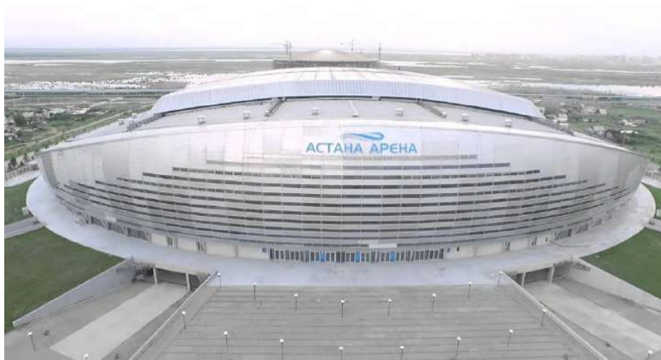
Рис. 3 – Стадион «Астана-Арена»

Для уникальных сооружений, таких как «Астана-Арена» в Астане, используется акустико-эмиссионный мониторинг (АЭ), который фиксирует трещины и коррозию в реальном времени, дополняемый геодезией и 3D-сканированием (рис. 3, 4). Для Дворца Мира и Согласия, применяют геодезические наблюдения и системы мониторинга, что повышает точность оценки состояния. Инновационные волоконно-оптические датчики (ВОД) обеспечивают мониторинг деформаций с высокой точностью, что позволяет локализовать дефекты в фундаментах и высотных зданиях [3].