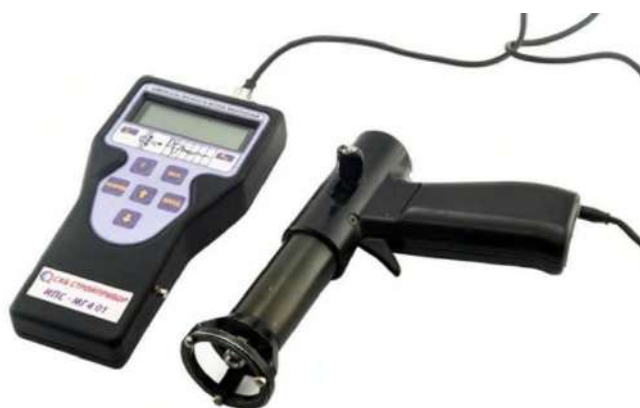
Рис. 2 – Прибор ударный импульс (ИПС)

Для уникальных сооружений, таких как «Астана-Арена» в Астане, используется акустико-эмиссионный мониторинг (АЭ), который фиксирует трещины и коррозию в реальном времени, дополняемый геодезией и 3D-сканированием (рис. 3, 4). Для Дворца Мира и Согласия, применяют геодезические наблюдения и системы мониторинга, что повышает точность оценки состояния. Инновационные волоконно-оптические датчики (ВОД) обеспечивают мониторинг деформаций с высокой точностью, что позволяет локализовать дефекты в фундаментах и высотных зданиях [3].