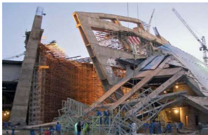
Рис. 6 - Аварийное обрушение на строительстве концертного зала «Казахстан»

За рубежом проблемы связаны с дороговизной технологий (например, SHM и ML) и сложностью их адаптации к мелким дефектам, однако автоматизация и стандарты (Eurocode, ACI) минимизируют эти недостатки. Общим вызовом остается необходимость раннего мониторинга для предотвращения прогрессирующего разрушения.