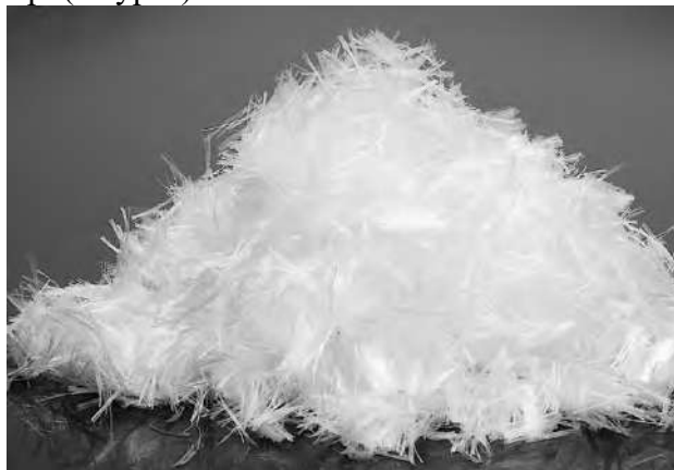
1 сурет – Полипропилен талшығы

Полипропилен талшығы (ППТ) – бетонның механикалық және ұзақ мерзімділік қасиеттерін жақсарту мақсатында қолданылатын тиімді қоспалардың бірі. Зерттеулер көрсеткендей, ППТ бетонның қысуға және иілуге беріктігін арттырып қана қоймай, оның серпімділік модулін жоғарылатып, мұздату-еру циклына төзімділігін күшейтеді. Сонымен қатар, сызаттардың түзілуін азайту және жоғары температураларға тұрақтылығын арттыру сияқты артықшылықтары бар. (1 сурет).