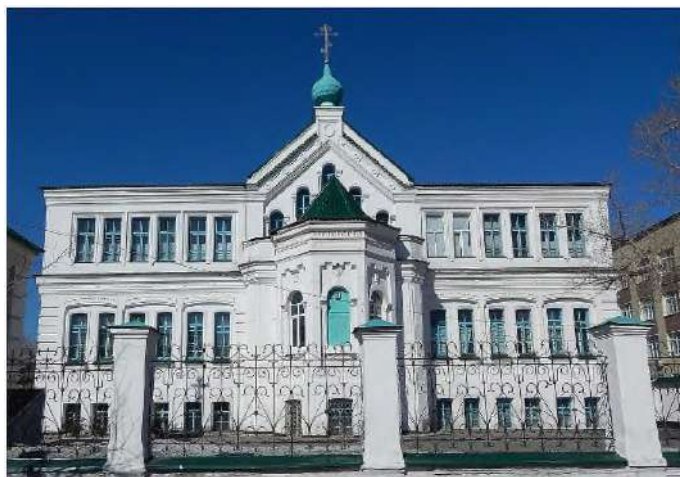
Рисунок 1. Петро-Павловский Абалацко-Знаменский женский монастырь в городе Семей.

В 1881 году была открыта Киргизская Духовная Миссия как филиал Алтайской миссии, просуществовав вплоть до 1917 года. Монастырь был основан в XIX веке, в период активного развития православной культуры на территории современного Казахстана. Его создание связано с усилиями русских миссионеров, стремившихся распространить православие среди местного населения [4].