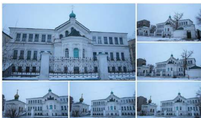
Рисунок 7. Петро-Павловский Абалацко-Знаменский монастырь в Семее.

В современную эпоху Петро-Павловский Абалацко-Знаменский монастырь выполняет роль не только религиозного центра, но и ключевого элемента культурной и социальной жизни региона. Его существование подчеркивает важность сохранения и развития духовных и культурных ценностей в многонациональном обществе [5].