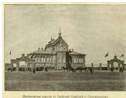
Рис.5. Миссионерская церковь в Заречной Слободке Семипалатинска.

Результаты показывают, что Петро-Павловский Абалацко-Знаменский монастырь играет значимую роль в сохранении православного наследия Семипалатинска. Сравнение с другими монастырями региона демонстрирует уникальность его архитектуры и религиозной значимости. Современные вызовы, такие как необходимость реставрации и поддержания интереса среди молодежи, требуют привлечения дополнительных ресурсов и разработки образовательных программ.