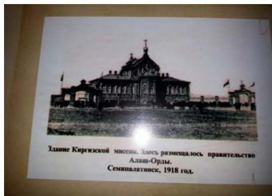
Рисунок 6. Миссионерская церковь в Заречной Слободке Семипалатинска.

Семей, как крупный центр и административный пункт в Казахстане, также сыграл роль в распространении православной культуры, и монастырь был важной частью этой динамики.