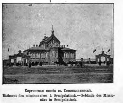
Рис.4. Киргизская миссия в Семипалатинске.

Первоначальный вид здания был изменен. В 1954 -56 годах была осуществлена пристройка второго этажа, что не испортило облик здания, а напротив придало ему величественный вид [9]. Здание монастыря является памятником культовой архитектуры и входит в государственный список памятников историко-культурного наследия Республики Казахстан [2].