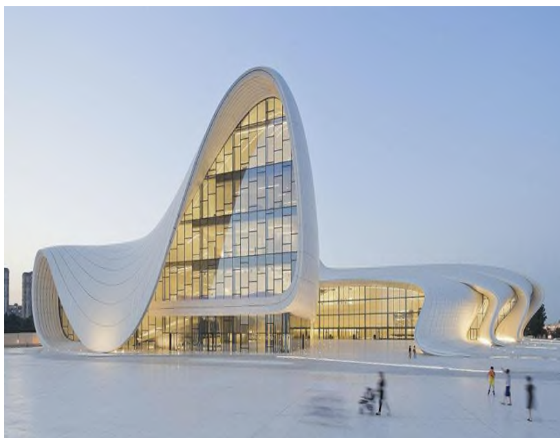
Рис. 1. Культурный центр Гейдара Алиева Баку, Азербайджан.

2. Генеративная архитектура – это направление, в котором вычислительные алгоритмы и искусственный интеллект используются для создания множества вариантов проектных решений. Вместо того чтобы разрабатывать один детализированный проект вручную, архитектор задаёт набор правил, ограничений и параметров, а система генерирует большое количество концепций. Вот основные аспекты генеративной архитектуры. Таким образом, генеративная архитектура меняет традиционный процесс проектирования, делая его более гибким, адаптивным и ориентированным на инновационные решения.