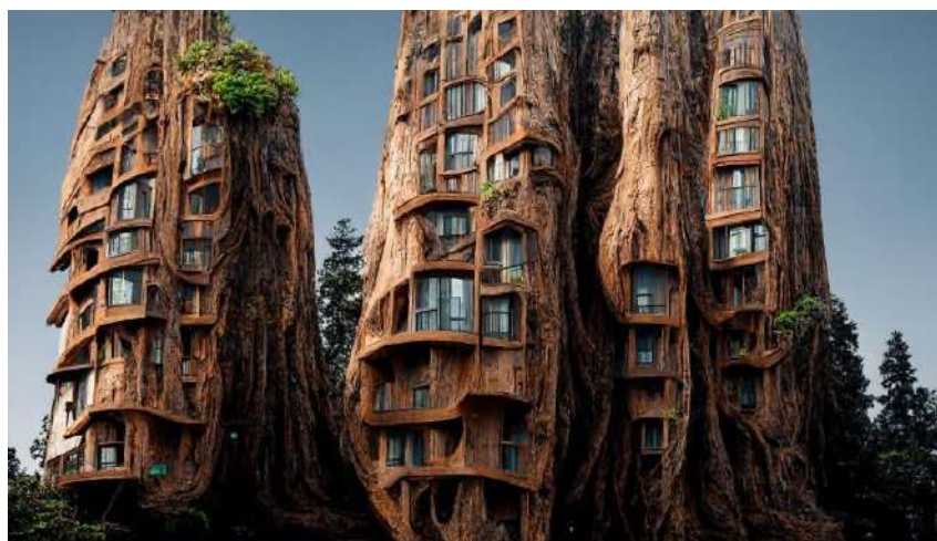
Рис.5. Изображение созданное с помощью нейросети Midjourney.

5. Биометрическая архитектура черпает вдохновение из природных форм и процессов, используя вычислительные методы для их анализа и воспроизведения. Это позволяет создавать устойчивые и эффективные конструкции, имитирующие природные системы и адаптирующиеся к окружающей среде. Этот стиль демонстрирует, как вычислительные технологии трансформируют архитектурное проектирование, открывая новые горизонты для творчества и функциональности, позволяя создавать такие проекты и выработать идеи, которые не могли и прийти в голову, таким примером может быть Симбиотическая архитектура Манаса Бхатия, созданная с помощью нейросети Midjourney (рис.5.).