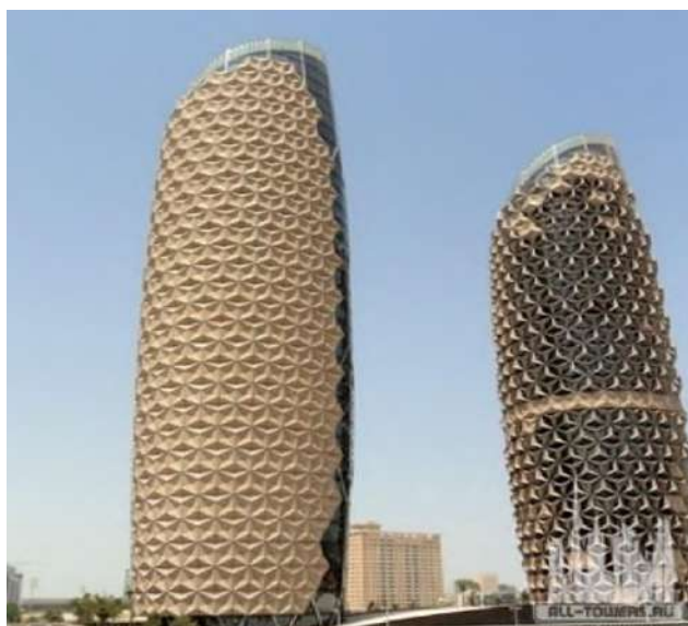
Рис.3. Al Bahar Towers, Абу-Даби, ОАЭ.

3. Интерактивная архитектура, включающая в себя элементы, которые реагируют на действия пользователей или изменения в окружающей среде. С помощью сенсоров и вычислительных технологий здания могут адаптироваться к погодным условиям, количеству людей или другим факторам, обеспечивая комфорт и эффективность. Как на примере Al Bahar Towers, Абу-Даби, ОАЭ фасад которых в зависимости от времени суток меняется, пропуская солнечный свет по большим углом и не пропуская под прямым (рис.3.).