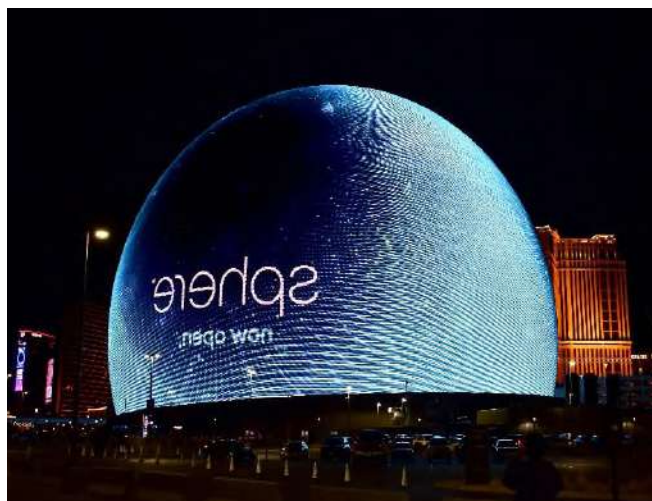
Рис.4. Sphere Парадайс, штат Невада (США).

5. Биометрическая архитектура черпает вдохновение из природных форм и процессов, используя вычислительные методы для их анализа и воспроизведения. Это позволяет создавать устойчивые и эффективные конструкции, имитирующие природные системы и адаптирующиеся к окружающей среде. Этот стиль демонстрирует, как вычислительные технологии трансформируют архитектурное проектирование, открывая новые горизонты для творчества и функциональности, позволяя создавать такие проекты и выработать идеи, которые не могли и прийти в голову, таким примером может быть Симбиотическая архитектура Манаса Бхатия, созданная с помощью нейросети Midjourney (рис.5.).