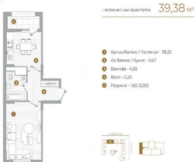
Рисунок 2. Однокомнатная квартира от Базис-А

В заключении исходя из последних тенденций, самое эффективное использование городской земли – это однокомнатные квартиры, микро-апартаменты и многоэтажные жилые дома. Они являются относительно доступной опцией, не смотря на полярно различающиеся мнения людей о них: одни видят в них решение кризиса, другие считают их «кроличьими норами» не подходящими для проживания человека.