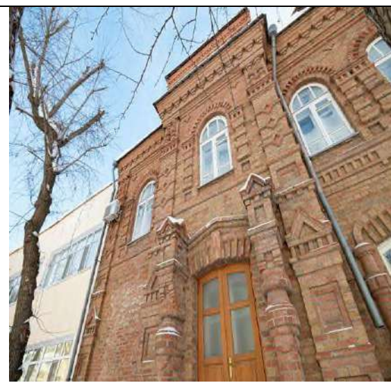
Рисунок 4. Дом П. Г. Моисеева

Кирпичный декор. Арочные оконные проемы: Окна первого и второго этажей оформлены в виде высокого арка, что придает изысканность и гармонию. Над арками окон выложены декоративные кирпичные перемычки в виде клиновидного узора, характерные для кирпичного стиля. Тонкая кирпичная плита. Фасад выполнен с применением декоративной техники кирпичной накладки. Выделяются мелкие геометрические элементы, такие как филёнки (выложенные кирпичом глубины в стене), которые выделяют фасада. В верхней части здания расположен сложный карниз, состоящий из нескольких рядов выложенных кирпичей. Он образует плавный переход между фасадом и крышей. Этот карниз служит не только эстетической, но и практической цели, защищая фасад от атмосферных воздействий. (Рис. 4) Центральная часть бокового фасада второго этажа украшена балконом с ковандой