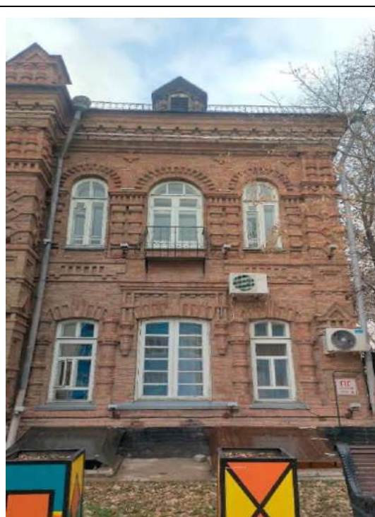
Рисунок 2. Фото дома купца Моисеева г. Астана