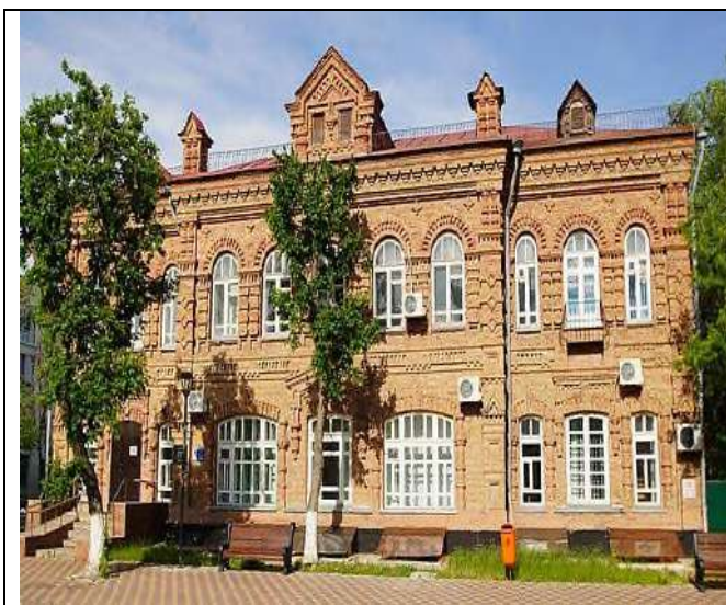
Рисунок 3. Дом П. Г. Моисеева

Кирпичный декор. Арочные оконные проемы: Окна первого и второго этажей оформлены в виде высокого арка, что придает изысканность и гармонию. Над арками окон выложены декоративные кирпичные перемычки в виде клиновидного узора, характерные для кирпичного стиля. Тонкая кирпичная плита. Фасад выполнен с применением декоративной техники кирпичной накладки. Выделяются мелкие геометрические элементы, такие как филёнки (выложенные кирпичом глубины в стене), которые выделяют фасада. В верхней части здания расположен сложный карниз, состоящий из нескольких рядов выложенных кирпичей.