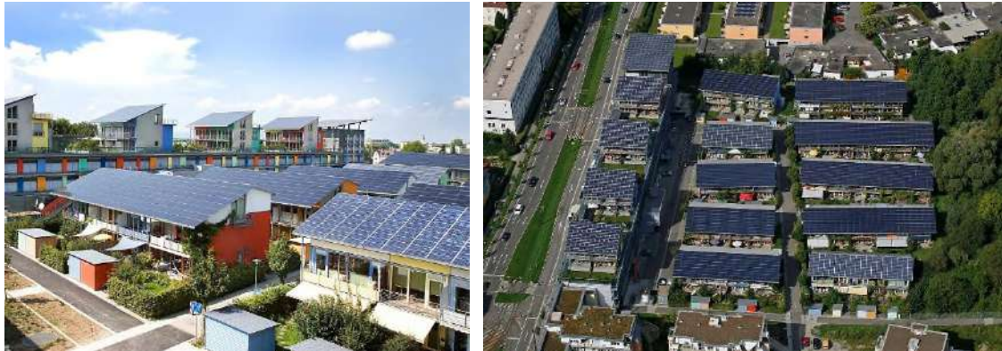
Figure 1. The Solar Settlement in Freiburg [5].

The Solar Settlement in Freiburg, Germany (Figure 1) is a pioneering example of a residential district that maximizes the use of solar energy. Designed by architect Rolf Disch, each building is oriented and shaped to capture the maximum amount of solar radiation, generating more energy than it consumes (Plus-energy houses).