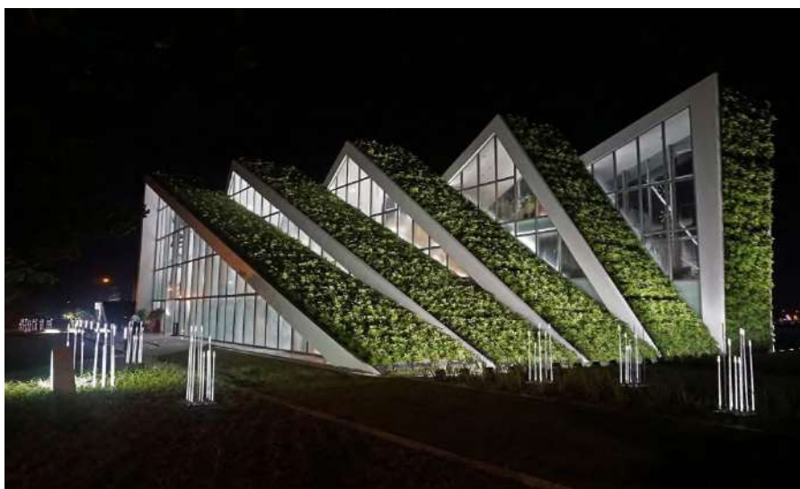
Рисунок 4. Зелёные крыши

В таком климате часто используются специальные архитектурные элементы, такие как навесы, перголы и жалюзи, которые могут блокировать прямые солнечные лучи, но при этом пропускать достаточное количество естественного света. В жарких регионах также популярны внутренние дворики и террасы, которые защищают от перегрева и создают комфортные зоны для отдыха.