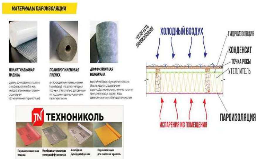
Рисунок 2. Изоляционные материалы

В регионах, подверженных сильным штормам, например, на побережьях океанов, проектирование зданий часто включает в себя высокие фундаменты, которые защищают их от наводнений и позволяют минимизировать ущерб от сильных дождей и ветра. Кроме того, природные ветровые потоки часто используются в архитектуре для создания естественной вентиляции, что способствует поддержанию комфортного микроклимата в помещении без использования механических систем.