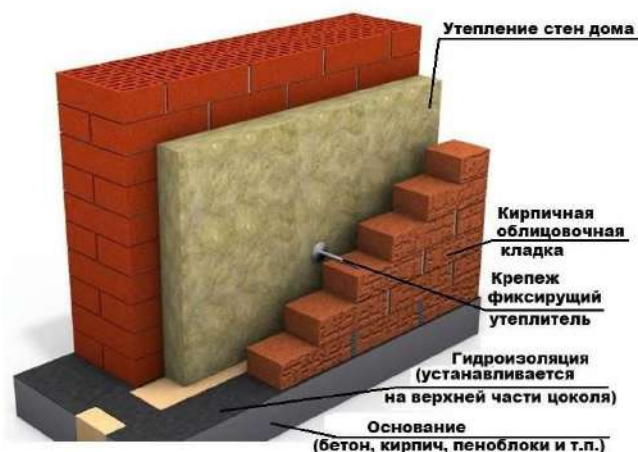
Рисунок 1. Утепление наружных ограждающих стен

Кроме того, климат влияет на выбор строительных материалов и их устойчивость к внешним воздействиям. Например, в регионах с высокой влажностью важно выбирать материалы, которые не будут разрушаться под воздействием влаги, такие как водоотталкивающие штукатурки, материалы с антисептическими свойствами, а также специальные пропитки для древесины.