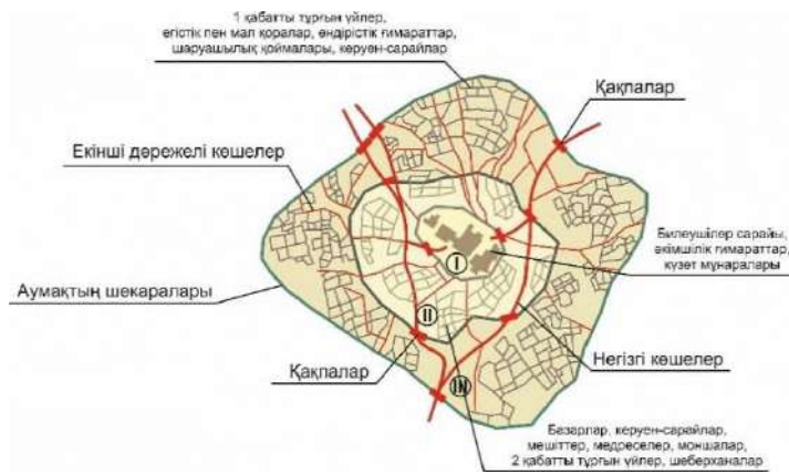
Сурет 1. Ежелгі Отырар қаласының картографиялық түсірілімі негізінде жасалған жоспар: I- Цитадель (Орда), II- Шахристан, III- Рабад

VIII–XII ғасырлар аралығында Орта Азиядағы қалалық қоныстардың дамуы әлемдік урбанизация үрдісімен тығыз байланысты болды. Басқамыр, Жанкент, Қойлық секілді қалалар оғыз, қарлұқ және қимақ мемлекеттерінің құрамында өркендеп, бекіністі құрылымдарымен (терең арықтар, темір қақпалар) және сауда орталықтарымен ерекшеленді. Бұл қалалардың инфрақұрылымы – сумен жабдықтау жүйелері, қоғамдық моншалар – ежелгі Римнен бастап ислам әлеміне дейінгі инженерлік шешімдердің бейімделген үлгілерін көрсетті. Мысалы, Тараздағы қыш құбырлармен жабдықталған су жүйесі мен жылу сақтайтын моншалар сол кезеңнің технологиялық жетістіктерін айқындайды.