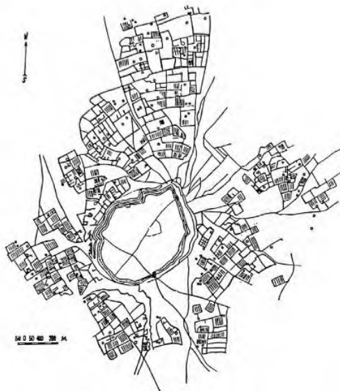
Сурет 3. Ежелгі Сауран қалашығының жоспары, XIII-XVIII ғғ.

метр созылды, шикі кірпіш пен пахсадан салынған төрт екі қабатты мұнара тромпалы күмбездермен және тар саңылаулармен әлемдік бекініс сәулетін көрсетеді және қазіргі экологиялық материалдарды қолданудың алғашқы үлгісі ретінде қарастырылды. Екі қақпа бар, солтүстік-шығыстағы негізгі қақпа екі мұнаралы 20 метр дәлізбен, оңтүстік-шығыстағы қақпа нашар сақталды, шығыс мұнарада ені 1,2 метр, биіктігі 1,7 метр доғалы өткел сақталды, қабырғаларды 3 метр тереңдікте, ені 15–20 метр ор қоршады. Негізгі көше ені 10 метр солтүстік-шығыс қақпадан басталып, 200 метрден кейін 18 метрге кеңейіп, 100 на 50 метр орталық алаңға жалғасты, орталық бекініс 800-ден 900 метрге дейін созылды, қалған 4 километр квадрат аумақтығыз құрылыспен толды, XVI ғасырдағы медреселер мен аулалық құрылымдар сақталды.