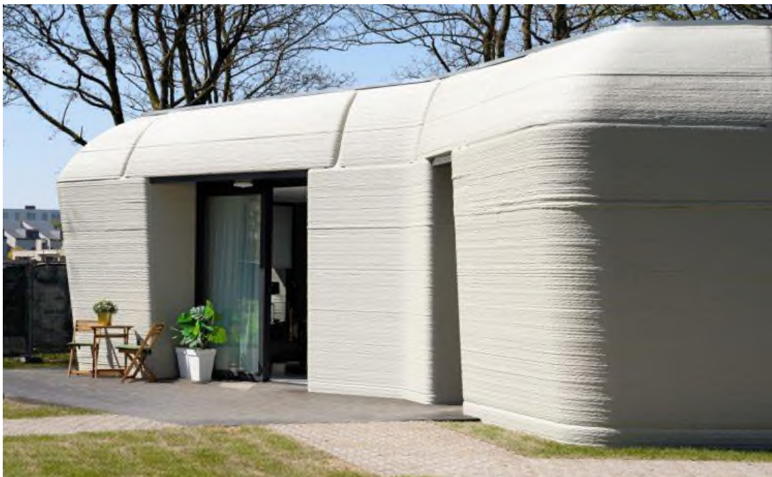
Рисунок 2. Дом в Эйндрховене, пример здания построенного с помощью 3-D принтера.

Для печати использовался специальный бетон, который обеспечивает прочность и долговечность конструкции. Плавные линии и нестандартные формы стен демонстрируют возможности. Технология 3D-печати позволяет минимизировать отходы строительных материалов, что делает процесс более экологичным.