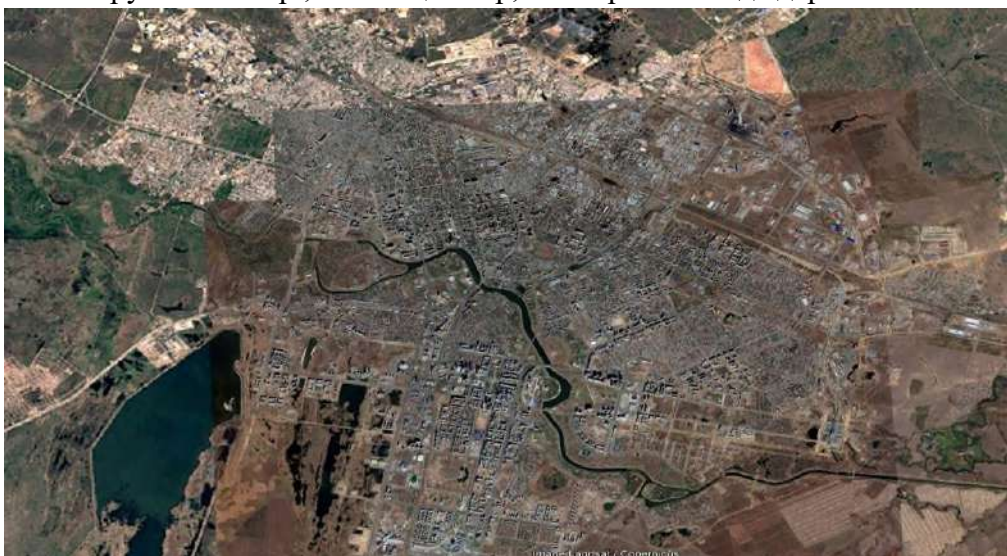
3-сурет. Астана қаласының 2017 жылығы LANDSAT спутнигі арқылы ғарыштан түсірілген суреті

2007 жылы Астана қаласында 574 448 ( 282 259 ерлер, 292 189 әйелдер) адам өмір сүрген. 1997 жылмен салыстырғанда 193 458 адамға немесе 50,78%-ға артқан. Халық санының артуына байланысты қалада инженерлік және әлеуметтік инфрақұрылым саласында кішігірім болса да мәселелер туындай бастады. Бұл урбандалу процесі кезінде міндетті түрде туындайтын мәселелердің қатарына жатады. Қиындықтарды шешу жолында қала басшылығы “ВІ Group”, “Базис-А” секілді құрылыс компанияларына үлкен сенім артты. Нәтижесінде денсаулық сақтау орындары, білім беру мекемелері, балабақшалар, кішігірім колледждер көптеп салына бастады.