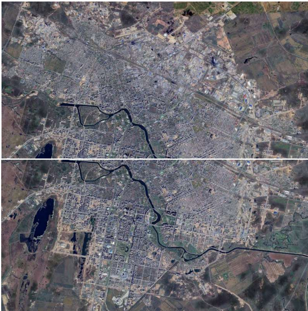
4-сурет. Астана қаласының 2024 жылығы LANDSAT спутнигі арқылы ғарыштан түсірілген суреті.

Астана 2017 жылы маусым айында тарихи нәтижеге қол жеткізіп миллионер қала мәртебесіне қол жеткізді. Халық саны 1 030 577, оның 495 945 ерлер болса, 534 632 әйелдер.