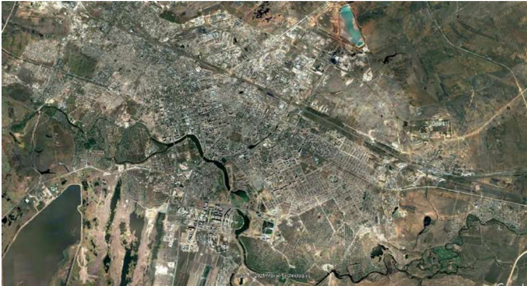
2-сурет. Астана қаласының 2007 жылғы “maxar technologies” компаниясының спутнигі арқылы түсірілген суреті.

Сурет 2007 жылдың шілде айында “maxar technologies” компаниясының спутнигі арқылы түсірілген. 1997 жылғы түсірілген суретпен салыстырғанда қаланың аумағы үлкейгенін байқауға болады. Дәлірек айтқанда қазіргі Алматы ауданының толығымен қамтылған және Есіл өзенінің сол жақ жағалауы, қазіргі Нұра және Есіл ауданы енді пайда бола бастағанын көреміз. “Бәйтерек” монументі 2002 жылы, Министрлер үйі 2003 жылы, Ақорда ғимараты 2004 жылы, Ұлттық кітапхана 2005 жылы бой көтергенін атап өткен жөн.