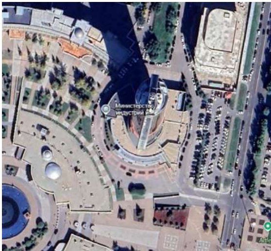
Рис.2 Карта из Google Earth