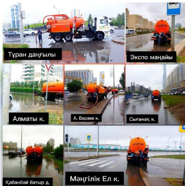
Сурет 1 Астана қаласындағы жиі жауын-шашын жиналатын көшелер

Зерттеу жұмысымының бірінші кезеңі жаңалықтар төңірегінде анализ, статистика жүргізу арқылы, Астана қаласында қай аймақтарды жиі су басатынын анықтау болып табылды (сурет 1).