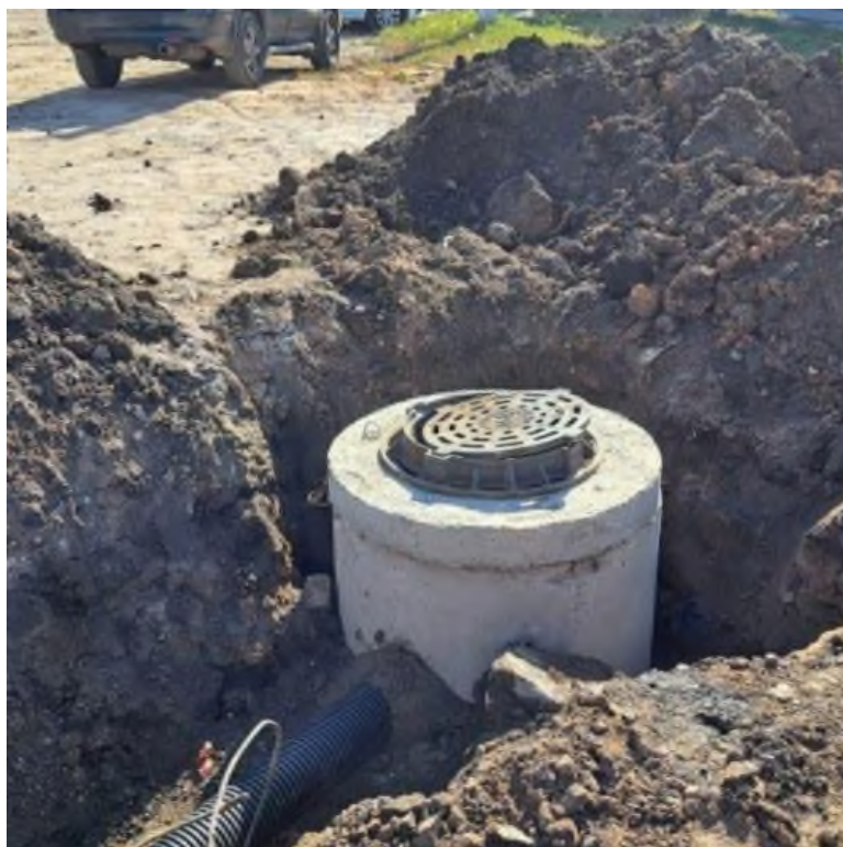
Сурет 3 Нөсер кәрізінің құрылысы

3-суретте нөсер кәрізінің құрылысын көруге болады. Бірақ, әр көшеде әртүрлі нөсер кәріздерінің желілері орнатылуы мүмкін. Жалпы бұл үлкен жүйе. Оған суретте көрсетілген нөсер кәрізінің құдығынан бастап, бақылауға арналған құдықтар, арнайы құбырлар және ең соңында жауын-шашын суын тасымалдап апаратын ағынды суларды тазарту қондырғылары кіреді. Ол да өз кезегінде ҚР арнайы нормативтері мен ережелерінің көмегімен орындалуы қажет. Егер орындалмаса онда нөсер кәрізі желісінің қуаты төмендейді.