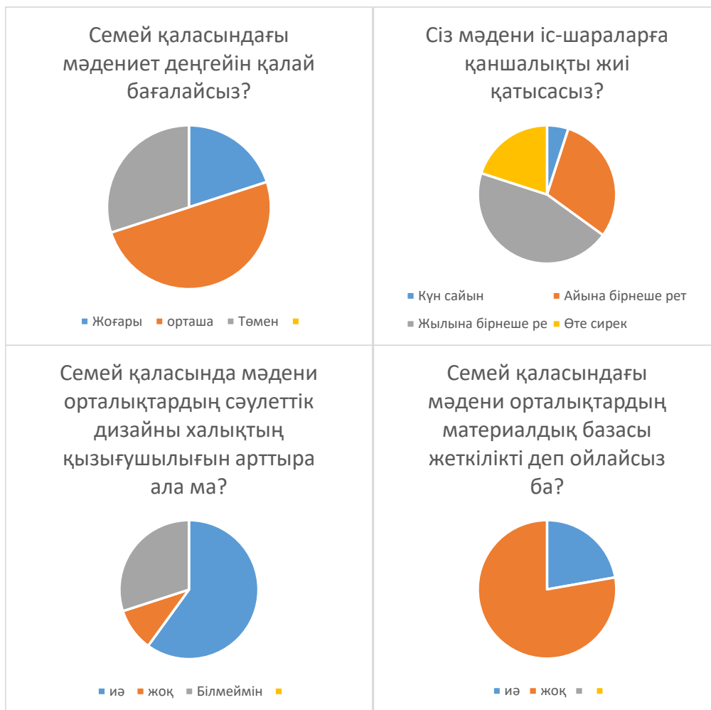
Сурет 1. Сауалнама нәтижелері

Зерттеу барысында көтерілген басты мәселелердің бірі – Семей қаласындағы мәдени мекемелердің жағдайы. Кейбір респонденттердің пікірінше, олар күткен деңгейде емес. Тарихи маңыздылығы мен кейбір объектілердің құндылығына қарамастан, олардың көпшілігі қалпына келтіру мен жаңартуды қажет ететін күйде. Ескі технологиялар, инфрақұрылымның тозуы және шектеулі ресурстар мәдени орталықтардың тиімді жұмыс істеуіне кедергі келтіріп, олардың азаматтарға тартымдылығын және қолжетімділігін төмендетеді.