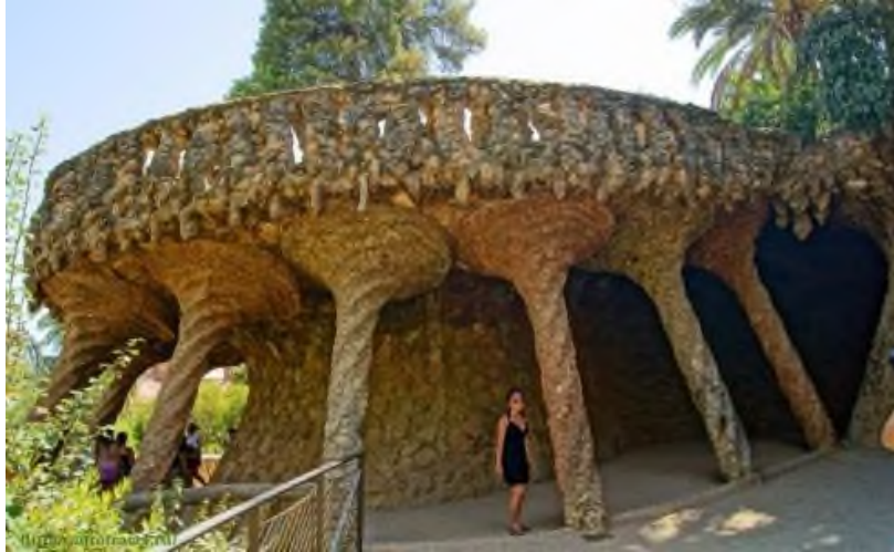
1 Сурет Антонио Гауд, Гуэль паркіндегі виадук, Барселона

инженерлік жобаларында тірі организмдерден шабыт алды. Оның құс қаңқасының құрылымын негізге ала отырып жасаған ұшу аппараттары бионикалық тәсілдің алғашқы мысалдарының бірі болып табылады. XIX ғасырдың соңында Антонио Гауди табиғи элементтерді сәулетте белсенді қолданды. Оның жобалары табиғи формалар мен биологиялық құрылымдардың құрылыс материалдарындағы көрінісін айқындады. XX ғасырда бұл тәсіл ғылыми негізделіп, дизайн мен өнерде кеңінен қолданыла бастады. (1 Сурет)