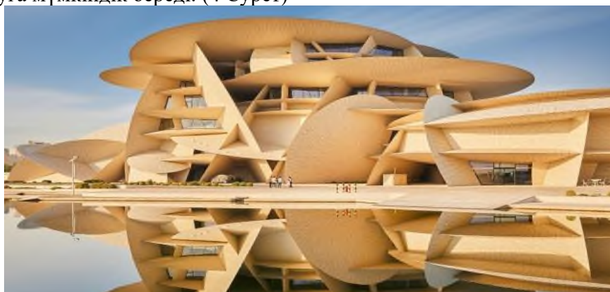
7 Сурет – Жан Нувель. Қатар ұлттық мұражайы. 2019ж.

Бионикалық сәулеттің маңызды аспектілерінің бірі – экологиялық тұрақтылық. Табиғи экожүйелерді имитациялай отырып, ғимараттар жылу оқшаулау, табиғи жарықтандыру және желдету тұрғысынан энергия тиімділігін арттырады. Мысалы, Катар ұлттық музейінің (арх. Жан Нувель) дизайны «шөл розасы» кристалдарының құрылымынан шабыттанған. Ғимараттың қасбеті энергия тиімді шыныдан жасалған, оның беткі қабаты күміс иондарымен қапталған. Бұл технология ішкі кеңістікті қызып кетуден қорғап, ғимараттың жылу энергиясын тиімді басқаруға мүмкіндік береді. (4 Сурет)