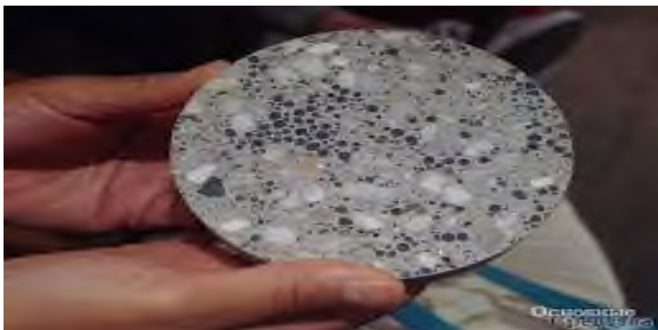
6 Сурет – Биобетон

Бионикалық сәулеттің маңызды аспектілерінің бірі – экологиялық тұрақтылық. Табиғи экожүйелерді имитациялай отырып, ғимараттар жылу оқшаулау, табиғи жарықтандыру және желдету тұрғысынан энергия тиімділігін арттырады. Мысалы, Катар ұлттық музейінің (арх. Жан Нувель) дизайны «шөл розасы» кристалдарының құрылымынан шабыттанған. Ғимараттың қасбеті энергия тиімді шыныдан жасалған, оның беткі қабаты күміс иондарымен қапталған. Бұл технология ішкі кеңістікті қызып кетуден қорғап, ғимараттың жылу энергиясын тиімді басқаруға мүмкіндік береді. (4 Сурет)