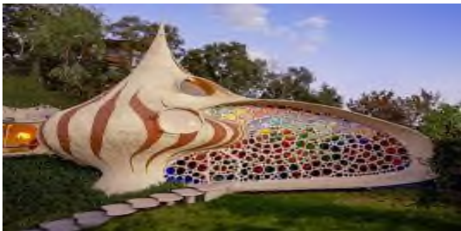
3 Сурет – Хавьер Сеносиан. Дом Наутилус, Наукальпан-де-Хуарес, Мехико, Мексика

Бионикалық сәулет табиғаттағы құрылымдарды модельдеу арқылы құрылыс материалдарын үнемдеуге және ғимараттардың беріктігін арттыруға мүмкіндік береді. Бионикалық дизайнда қабаттық құрылымдар жиі қолданылады. Мұндай құрылымдар табиғатта кең таралған, мысалы, моллюск қабыршақтары немесе өсімдік талшықтары. Олар жүктемені тиімді таратып, материалдың механикалық қасиеттерін жақсартады. Мысалы, Nautilus House (Мексика, 2006) моллюск раковинасының спиральді құрылымына негізделген. Ғимараттың қабырғалары мелкозернисті бетоннан жасалып, болат арматурамен күшейтілген. Мұндай құрылым аэродинамикалық сипаттамаларға ие және сейсмикалық тұрақтылықты қамтамасыз етеді. (3 Сурет)