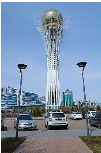
6 Сурет – Бәйтерек монументі, Астана

1997 жылы басталып, 2002 жылы аяқталды. «Бәйтерек» монументі өзінің құрылымы жағынан ағаштың пішінін қайталайды. Оның негізі – тамыры, тірек бөлігі – діңі, ал жоғарғы жағындағы алтын шар – тәжі болып табылады. Бұл құрылым табиғаттағы тұрақтылық қағидаларын сәулетке енгізудің айқын мысалы болып саналады. ( 7 Сурет)