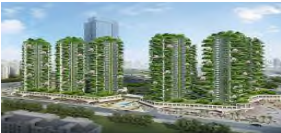
5 Сурет – Qiyi City Forest Garden, Қытай.

Қазіргі сәулет өнерінде табиғи формалар мен құрылымдарды зерттеп, оларды инженерия мен архитектурада қолдану маңызды бағыттардың бірі болып табылады. Қазақстанның бас қаласы Астанада бірнеше ірі сәулеттік нысандарда бионика принциптері көрініс тапқан. Бұл нысандар тек заманауи архитектуралық шешімдерді ғана емес, сонымен қатар табиғи процестерге негізделген тұрақтылықты қамтамасыз етеді.