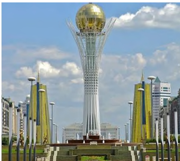
3 сурет Бәйтерек

табылады, сондықтан оны архитектура мен құрылыс саласындағы жаңашылдықтың, беріктік пен функционалдылықтың символы саналады.