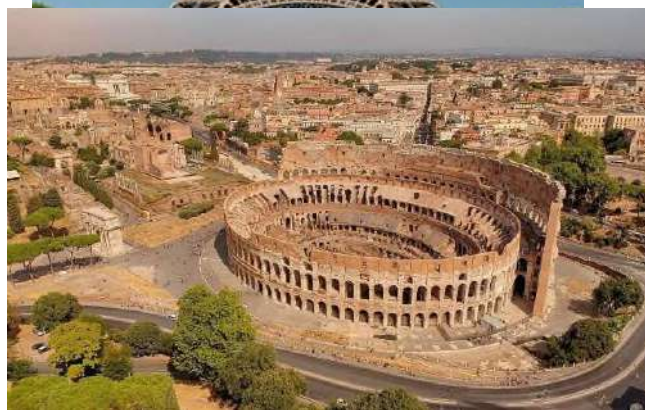
2 сурет Колизей

мұнарасы сәулет өнері мен технологияларының дамуын мысал. Оның жобалануы мен көптеген инженерлер мен шабыт беруде. Бұл нысан тек емес, сонымен қатар материалтану және жетістіктерін біріктіретін