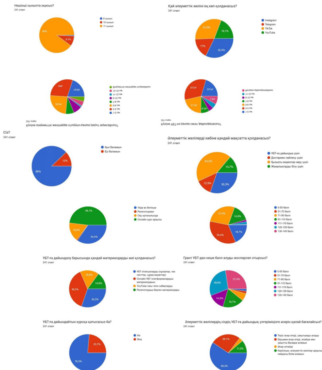
1 - сурет. Сауалнама нәтижесі

12. Әлеуметтік желілердің сіздің ҰБТ-ға дайындық үлгеріміңізге әсерін қалай бағалайсыз? (Теріс әсер етеді, уақытымды алады - 143 оқушы (59,3%), Біршама әсер етеді, алайда мен уақытты басқара аламын - 63 оқушы (26,1%), Әсер етпейді - 8 оқушы (3,3%), Керісінше, әлеуметтік желілер арқылы пайдалы білім аламын - 27 оқушы (11,2%)) түріндегі нәтиже алынды (олар диаграмма түрінде 1-суретте келтірілген).