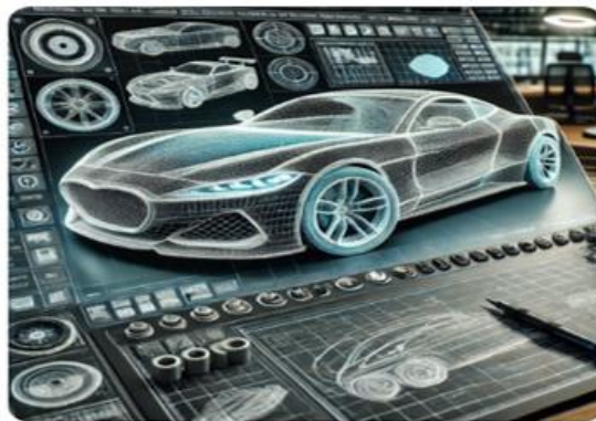
Рисунок 2. дизайн автомобиля, выполненный в системе CAD

Изображение, показывающее использование моделирования CFD в анализе аэродинамики автомобиля. На этом рисунке скорость и распределение давления воздушного потока показаны разными цветами. Красные и желтые области представляют области высокого давления, а синие и зеленые области представляют области низкого давления. Этот метод помогает улучшить аэродинамику автомобиля и создать эффективный дизайн.