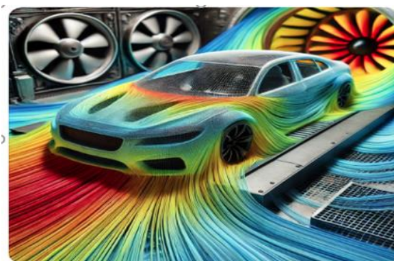
Рисунок 1. применение CFD-моделирования при изучении аэродинамики автомобиля