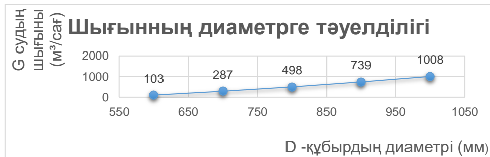
4-сурет: Шығынның диаметрге тәуелділігі

Есептің шешімдерінде барлық ағын режимдері турбулентті болады. Жалпы қабықшатүтікшелі жылу алмастырғыштар әртүрлі критерийлер бойынша жіктеледі: жылу беру әдісі, сұйықты салқындату және т.б. Жылу алмастырғыш жабдықтардың алуан түрлілігі жылу алмастырғыштарға қойылатын екіұшты талаптармен байланысты, олардың жұмыс жағдайына тәуелді. Жылу алмастырғыш қондырғыларға қойылатын келесі талаптар негізі болып табылады. Олар: өндіріс кезінде материалдардың минималды шығыны, материалдың салқындатқыштардың коррозиялық әсеріне төзімділігі, жабдықтың сенімділігі мен төзімділігі [3].