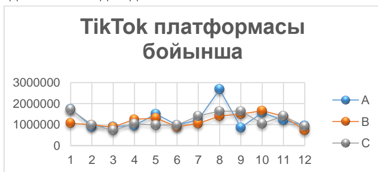
График-1. ТікТок платформасының әсері

Бұл бюджет оңтайлы, өйткені егер жарнама шығындары 300000-нан аз болса, онда мейрамхана клиенттерді аз алады, өйткені қажетті санды тарту үшін қаражат жеткіліксіз. Егер жарнамалық шығындар 300000-нан асатын болса, жарнама тиімсіз болады, өйткені шығындардың қосымша өсуі клиенттер санының пропорционалды өсуіне әкелмейді, бұл инвестициялардың тиімділігін төмендетеді.