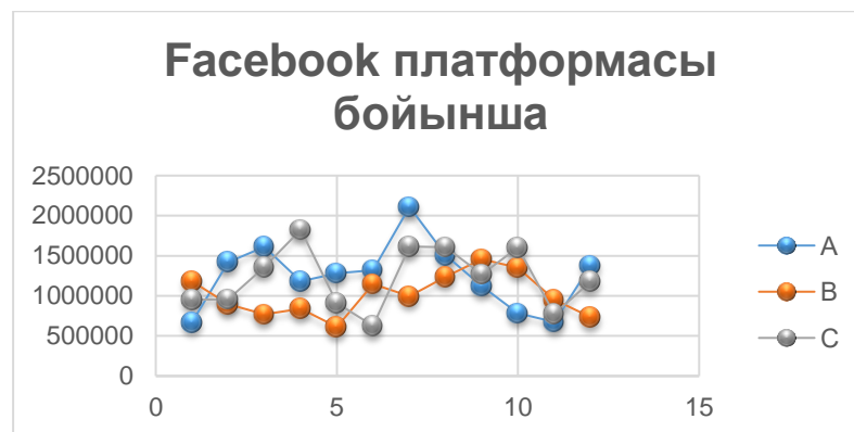
График-3. FaceBook платформасының әсері

Осылайша, жарнамалық шығындарды тиімді бағалау және басқару үшін: