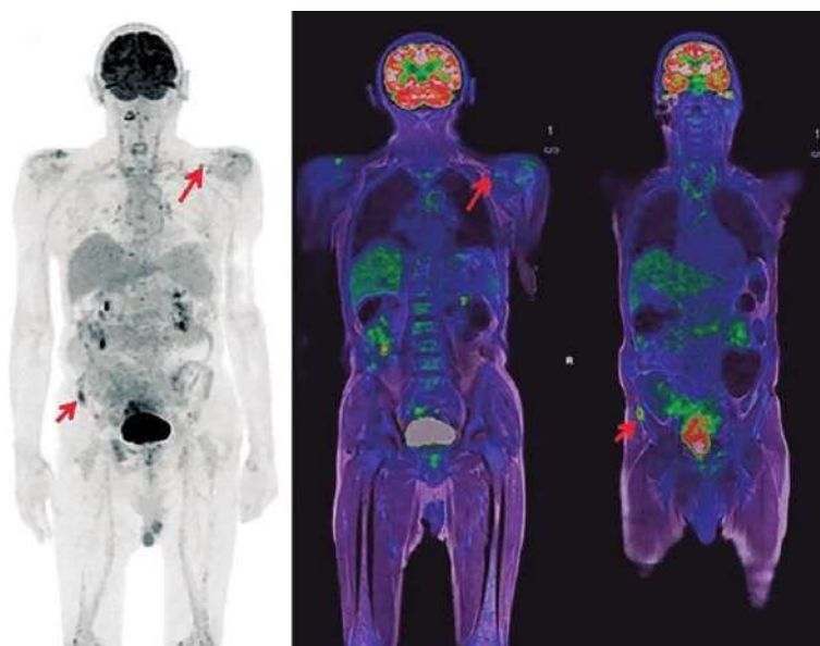
2-Сурет –Онкологияда ПЭТ/КТ қолданылуы.

6. ПЭТ/КТ-ны мыналардан ерте емес жүргізу ұсынылады: химиотерапияның соңғы курсы аяқталғаннан кейін 1 айдан кейін; сәулелік терапия немесе хирургиялық емдеу аяқталғаннан кейін 3 айдан кейін;