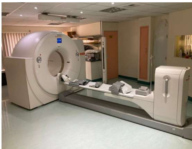
Сурет 1. Сәулелік терапияны жоспарлау мүмкіндігі бар ПЭТ/КТ; анатомиялық және метаболикалық суреттер науқаспен бір қалыпта алынады

Жатыр мойны обыры үшін емдеуді жоспарлаудың алтын стандартты бейнелеу процедурасы MPT болып табылады. FDG-PET/CT нәтижелері клиникалық FIGO кезеңінің