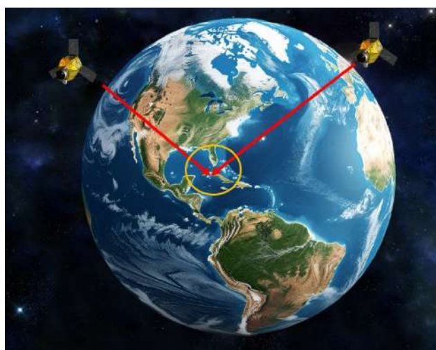
Рисунок 2 - Изображение риска столкновения двух космических аппаратов

Так же необходимо визуально представить возможность риска столкновения. На рис. 2 указано изображение вероятности столкновения двух космических объектов на околоземном пространстве, риск столкновения возникает в случае, если орбиты двух объектов проходят в опасной близости друг от друга.