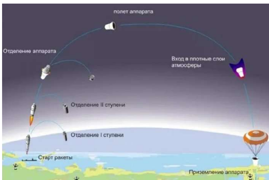
Рисунок 1 – Этапы запуска и приземления КА

Запуск космического аппарата сопровождается значительными аэродинамическими и тепловыми нагрузками, вызванными прохождением плотных слоев атмосферы. В этот период важную роль играет конструкционная теплоизоляция и эффективная рассеяния тепла от работающих двигателей. Основные тепловые воздействия связаны с трением воздуха, а также нагревом от реактивных струй двигательной установки. При возвращении аппарата на Землю аэротермодинамические процессы становятся критически важными. Приземление сопровождается замедлением аппарата за счет парашютных систем или ретро-двигателей, что снижает нагрузки на конструкцию. В целом, запуск и приземление космического аппарата представляют собой чрезвычайно сложные процессы, требующие точного расчета и тщательного проектирования (рисунок 1).