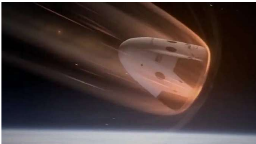
Рисунок 2 –Вход в атмосферу Земли космического аппарата

Так же необходимо учесть, что при экстремальных температурах, возникающих в ударном слое, может происходить испарение и сублимация поверхностных материалов, что влияет на аэротермодинамические характеристики аппарата. Кроме того, формирование ионизированного газа вокруг корпуса может приводить к возникновению радиопомех, затрудняющих связь с наземными станциями. В зависимости от скорости входа и состава атмосферы возможно также образование локализованных разрядов плазмы, что требует учета при проектировании электроники и систем связи аппарата.