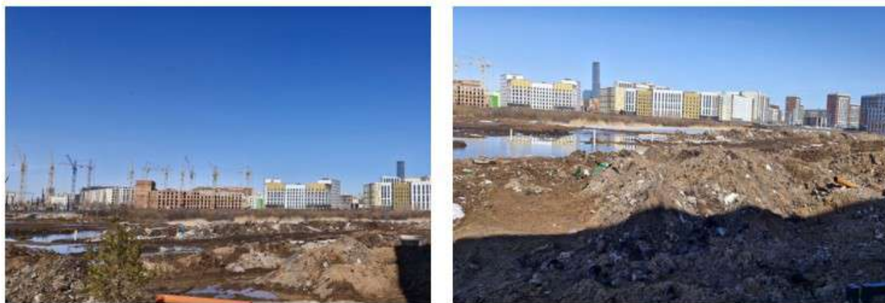
Сурет 4 - Астана қаласындағы Әл-Фараби даңғылының маңында құрылыс жұмыстарының нәтижесінде пайда болған қоқыс үйіндісі

Зерттеу нәтижелері бойынша 2019-2024 жылдар аралығында ТҚҚ полигонының аумағында айтарлықтай кеңею байқалды. Әсіресе, 2021-2022 жылдар аралығында полигон ауданы күрт ұлғайған, бұл қалада құрылыстың қарқынды жүргізілуімен байланысты болуы мүмкін. Сонымен қатар, 2023-2024 жылдары құрылыс қалдықтарының көптеп жиналған аймақтары Жер серіктердің көмегімен түсірілген суреттер арқылы тіркелді. Бұл қалдықтар негізінен жаңа тұрғын үйлер салынған жерлерде анықталды (4-сурет). Мониторинг нәтижелері ғарыштық Жерді қашықтықтан зерттеу (ЖҚЗ) деректерін қалдықтардың таралуын бақылау және экологиялық жағдайды бағалау үшін тиімді пайдалануға мүмкіндік беретінін көрсетті.