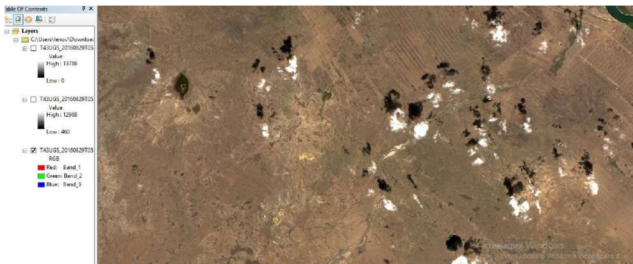
Сурет 1 - Семей полигонындағы жарылыстар бірнеше жерде болған. Бұл сурет Курчатов қаласана жақын жерде болған жарылыс көрінісі. Сурет масштабы 1:95 629

ауырулары, қан аурулары және жүйке жүйесінің бұзылуы сияқты аурулардың сан артты. Семей аймағындағы экологиялық жағдай мен халықтың денсаулығына кері әсер ететін факторлар бүгінгі күнге дейін өзекті мәселелер болып отыр. Полигонның құрылғаннан кейінгі кезеңде, ядролық сынақтардың радиациялық әсері жергілікті флора мен фаунаға да теріс әсерін тигізді. Радиоактивті қалдықтардың топырақта, суда және ауада жиналуы ауылшаруашылығың дамуына зиян келтірді. Бұл аймақта жүргізілген экологиялық зерттеулер көрсеткендей радиациялық ластану ауыр металдардың топырақта және өсімдіктерде жиналуына себеп болды. Бұл өз кезегінде аймақтағы экологиялық дағдарысты тереңдетті, әрі ауылшаруашылығының өнімділігін айтарлықтай төмендетті. Сонымен қатар, су ресурстары да ауыр металдармен басталып олардың сапасы күрт төмендеді. [3] [4] [5]