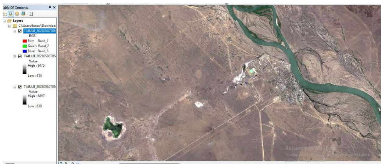
Сурет 1 - Сурет масштабы 1:83 321