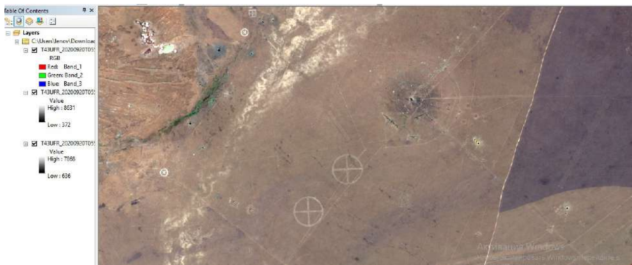
Сурет 2 - Сурет масштабы 1:46 911

Сурет 1. Курсчатов қаласына жақын жерде болған жарылыс. Сурет 2. Курсчатов маңынан алыс жерде болған жарылыс. 2020 жылғы суретте 2016 жылмен салыстырғанда айтарлықтай үлкен өзгерістер байқалмайды. Кей жерлерде жасыл аймақтардың біршама ұлғайғаны көрінеді, бірақ жалпы шөлейттену деңгейі өзгеріссіз дерлік. Топырақтың түсі мен құрылымында айтарлықтай айырмашылық жоқ, эрозия іздері сол қалпында сақталған. Жаңа жолдар немесе басқа құрылыс нысандары көп байқалады.