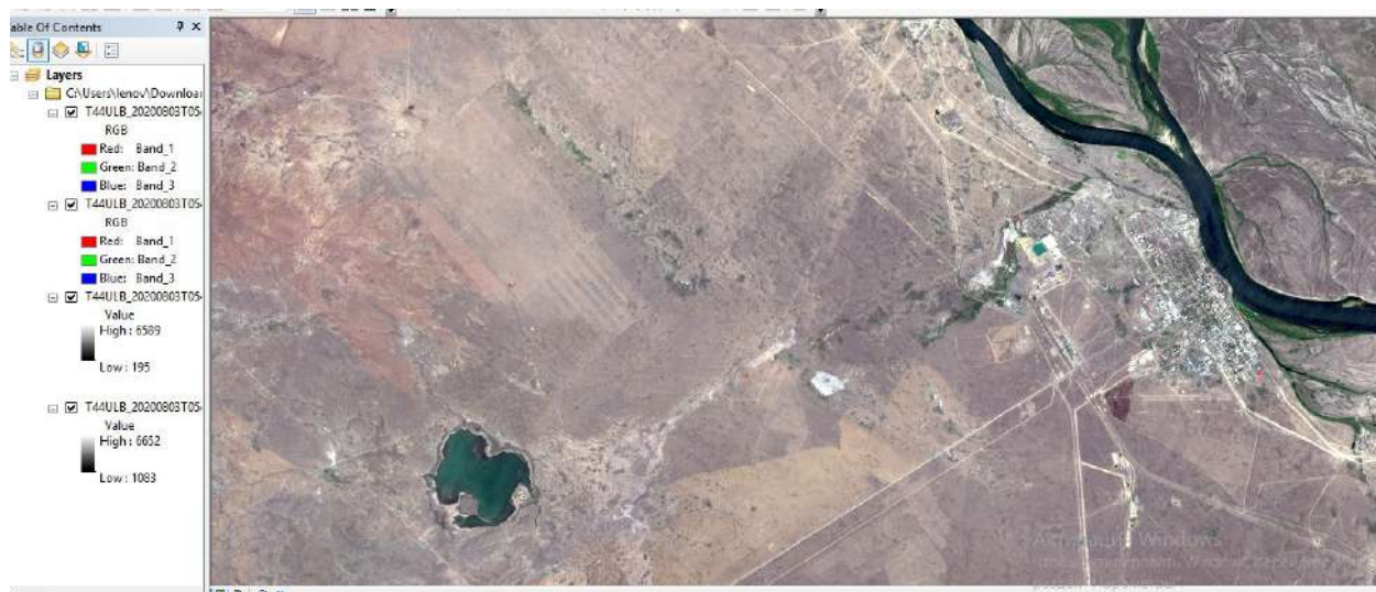
Сурет 1 - Сурет масштабы 1:74 609

Суретте жердің шөлейттенуі, өсімдіктің аздығы байқалады және ландшафттың әртүрлілігі мен топырақтың өзгерістері көрінеді. Полигон жабылғаннан кейін жердің қалпына келуі баяу жүруде. Радиациялық ластану мен эрозия табиғи қайта қалпына келуге кедергі келтіруде. Кейбір аймақтарда өсімдік жамылғысы қалпына келе бастады, бірақ толық табиғи ландшафт әлі қалпына келген жоқ. 2016 жылы Семей полигонындағы жердің экологиялық жағдайы әлі де күрделі. Топырақтың құнарлылығы төмен, өсімдіктер сирек, ал кейбір аймақтар өзгеріссіз қалып отыр.