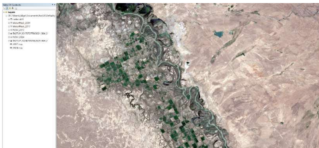
Сурет 1 - 2024 жылғы Сырдарья өзенінің спутниктік суреті

Бастапқы деректер ретінде Copernicus платформасы арқылы алынған 2017 және 2024 жылдардағы маусым айындағы Sentinel-2 суреттері пайдаланылды. Талдау үшін су нысандарын бөліп көрсетуге мүмкіндік беретін NDWI (Normalized Difference Water Index) есептеу әдісі қолданылды. Деректер ArcGIS бағдарламасында Raster Calculator және Zonal Statistics құралдарын пайдалану арқылы өңделді.[1,3,4]