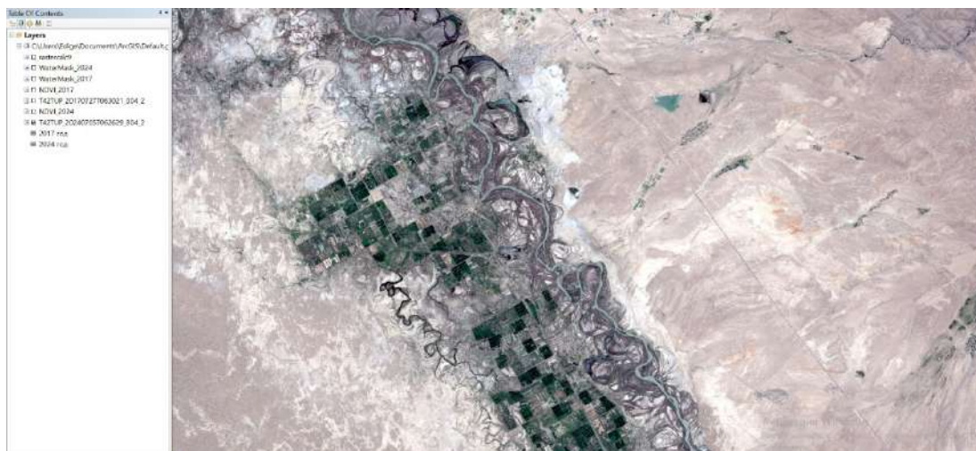
Сурет 2 - 2017 жылғы сырдарья өзенінің спутниктік суреті