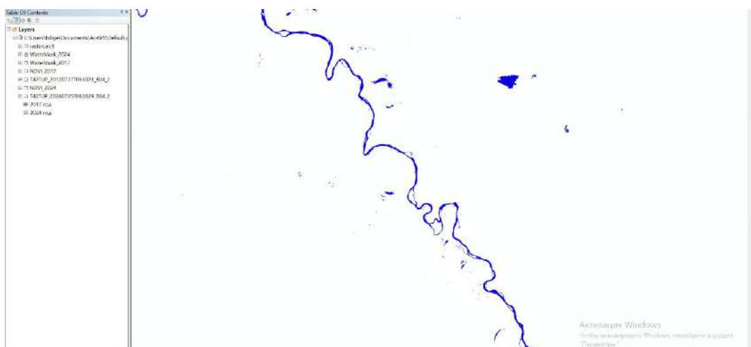
Сурет 4 - Сырдарья өзенінің 2024 жылғы су ауданы